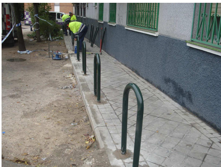
Calle Tiedra (Distrito de Villa de Vallecas)

La competencia para la conservación del mobiliario urbano corresponde a esta Dirección General, excepto el mobiliario instalado en los parques de conservación integral y el incluido en contratos específicos.