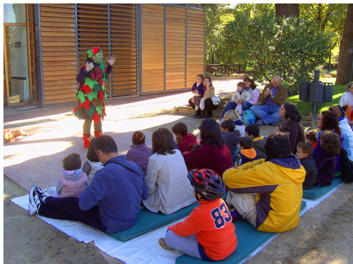
Cuentacuentos en el CIEAC de la Casa de Campo