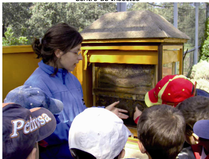
Centro de Insectos