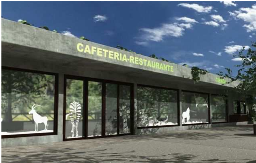
Cafetería-restaurante del Zoo-Aquarium

Durante el año 2011 se han autorizado las obras de funcionamiento de la tienda principal, que incluye los siguientes servicios: cafetería-restaurante, tienda, punto de información y aseos públicos.