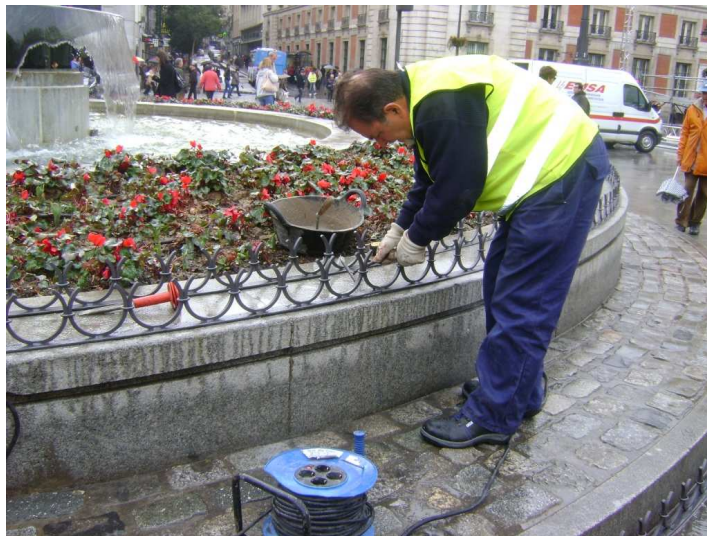
Puerta del Sol (Distrito de Centro)

De los trabajos realizados de conservación del mobiliario, una gran parte corresponde a la retirada de elementos de mobiliario dañados por accidentes, vandalismo, deterioro o roturas propias del uso diario de los elementos, para evitar que puedan poner en peligro la integridad física de los ciudadanos de Madrid.