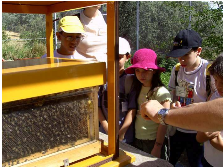
Centro de Insectos