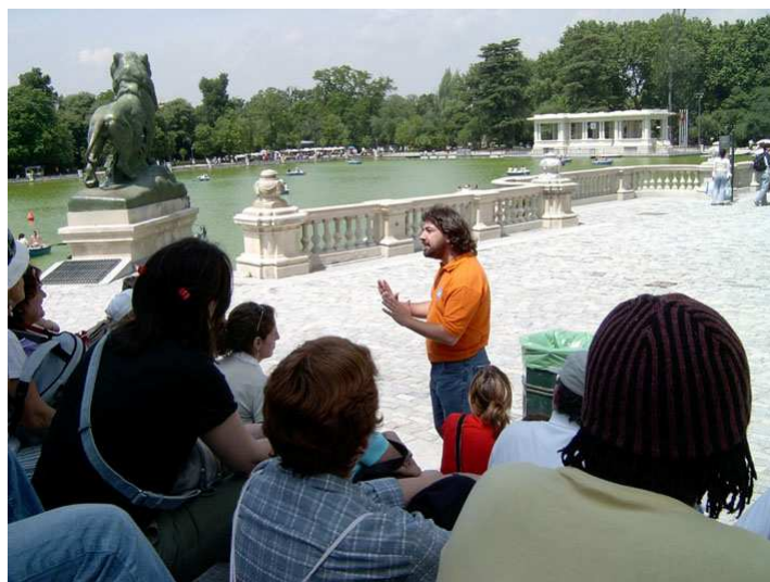
Visita guiada. Jardines del Buen Retiro.

Con los itinerarios guiados , se invita a descubrir la riqueza cultural y ambiental, que los parques de Madrid ofrecen y conocer otros elementos, como sus valores artísticos y singulares. Los paseos interpretativos realizados en 2011 han cubierto una amplia gama de temáticas y de parques y zonas verdes de la capital, entre los que se encuentran los Jardines del Buen Retiro, la Casa de Campo, la Dehesa de la Villa, el Parque de Juan Carlos I, Madrid Río, el Jardín del Capricho, el parque de la Fuente del Berro, la Quinta de los Molinos, o el parque de Juan Pablo II, e itinerarios ornitológicos en estos parques y otras zonas verdes, como el Parque del Oeste y la zona abierta del Monte de El Pardo.