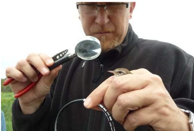
Anillamiento de aves

durante 2011 han sido muy elevados, convirtiéndose en un referente nacional como estación urbana de anillamiento científico.