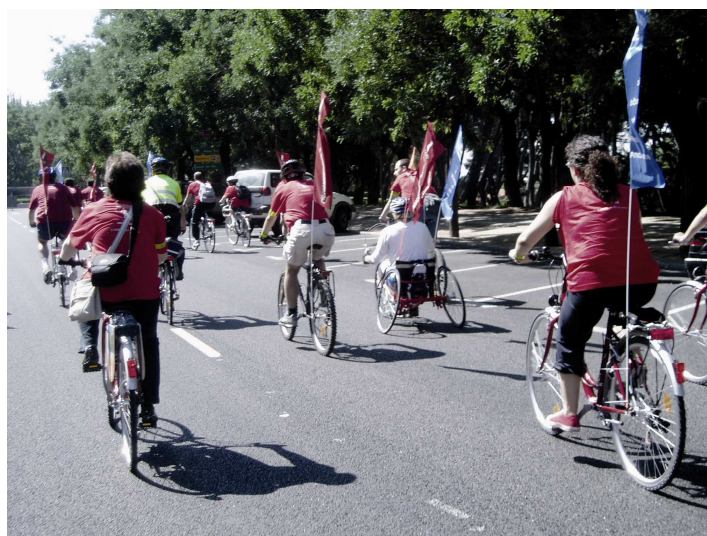
Marcha en bicicleta