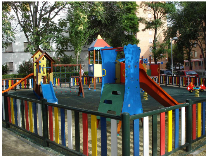
La Corte del Faraón (Distrito de Villaverde)

El Ayuntamiento de Madrid, a 31 de diciembre de 2011, tenía instaladas en la ciudad 1.901 áreas infantiles tanto en sus parques y jardines como en la vía pública. A lo largo del 2011 se han recibido de otros servicios municipales 39 áreas infantiles nuevas, y por diversos motivos se han retirado 4. A continuación se muestran imágenes de algunas de las áreas infantiles recepcionadas por esta Dirección General a lo largo de 2011: