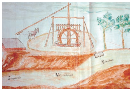
Norias en el Prado. S. XVIII.

Salvo dos pequeñas adquisiciones de archivos privados, los fondos proceden del propio Ayuntamiento y de los Ayuntamientos que Madrid se anexionó en los años 50 del siglo pasado. Las series más destacadas son: Los libros de acuerdos,