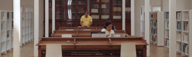
Sala de consulta.