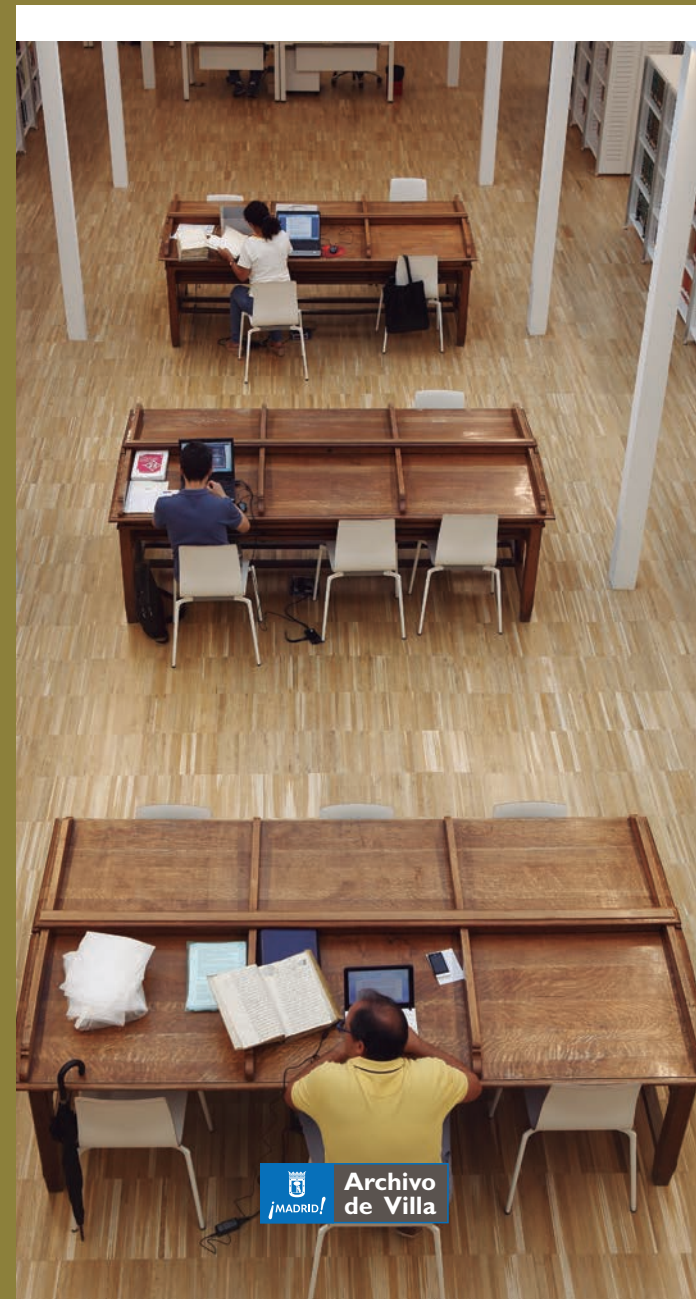
Imagen portada: Sala de investigación.