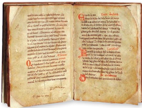
Fuero de Madrid. 1202.

Aparece mencionado por primera vez en una Real Provisión de Carlos I (1525) aunque el arca de las tres llaves, depósito medieval de los pergaminos madrileños, es citada repetidamente en