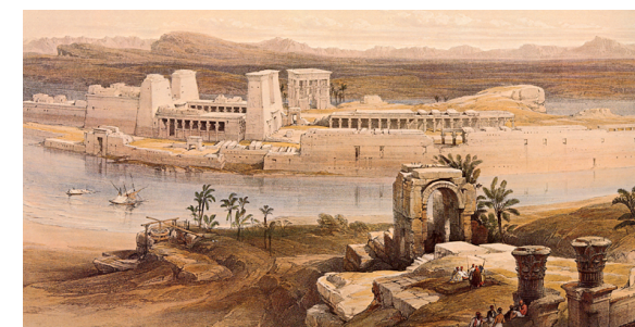
El templo de Isis en la Isla de Filé, en la 1ª Catarata.