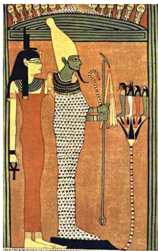
Isis protegiendo a Osiris