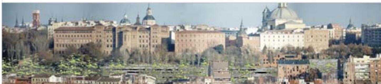
VISTA DE LA CORNISA ESTADO ACTUAL Y PROPUESTA