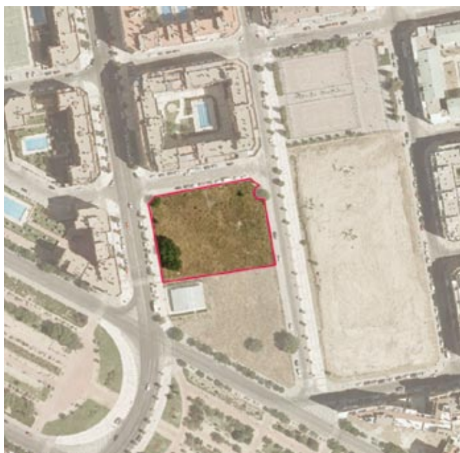
Derecho de Superficie de la parcela ES-2A/ API 20-09 "Las Rosas" cedida a la Comunidad de Madrid para edificar una biblioteca pública