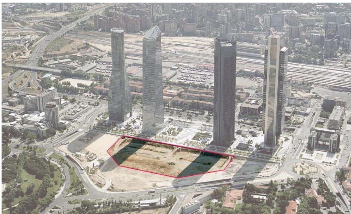
Autorización de ocupación de la parcela P.5 APR 08.04 "Ciudad Deportiva" para la construcción de Centro Internacional de Convenciones