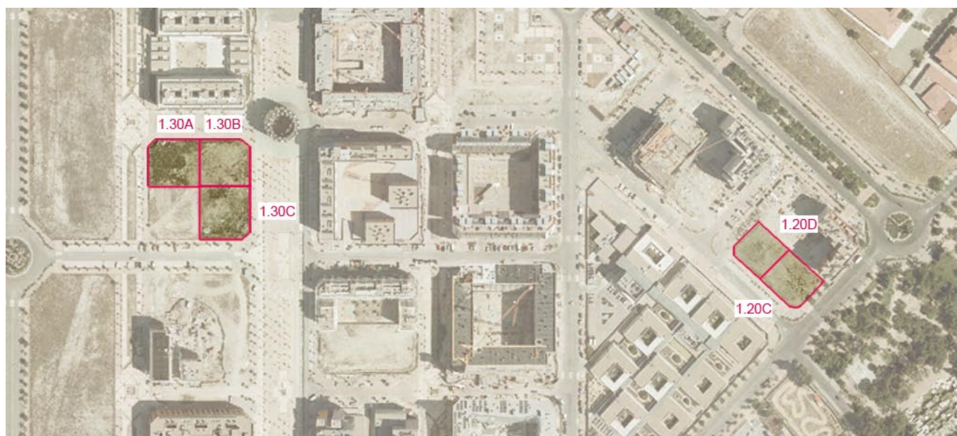
Parcelas 1.20C, 1.20D, 1.30A, 1.30B y 1.30C del UZP 1.03 "Ensanche de Vallecas", transmitidas en aportación de capital a la EMVS para la construcción de viviendas