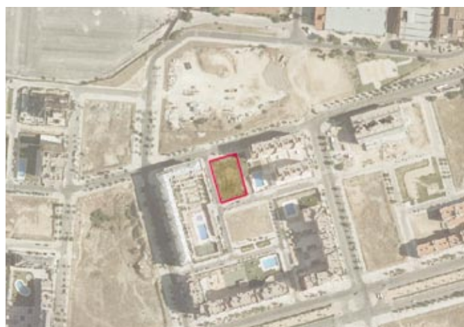
Parcela 4.7.2 A/B UZI 0.10 "Ensanche de Carabanchel" cedida a la EMVS para la construcción de vivienda en régimen de protección pública