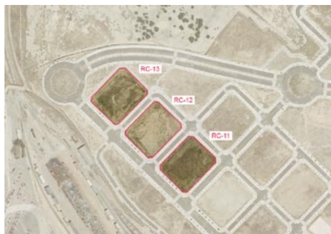
Parcelas RC-13 y RC-11/ UZP 1.05 "Barrio de Butarque", cedidas a la EMVS y parcela RC-12 transmitida en aportación de capital a la EMVS, todas para la construcción de viviendas en régimen de protección pública