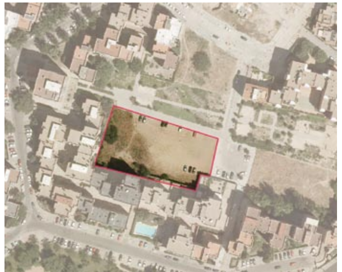
Autorización de ocupación de la parcela en la calle Isla Bisagos, (Moncloa-Aravaca), para la construcción de un equipamiento educativo