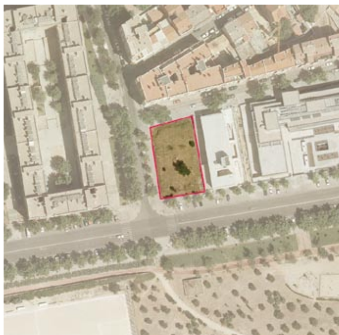
Derecho de superficie de la Parcela X-3/ API 10.10 "Cuña de Latina" cedida a una Asociación Privada para un Centro de Atención Social e Integración