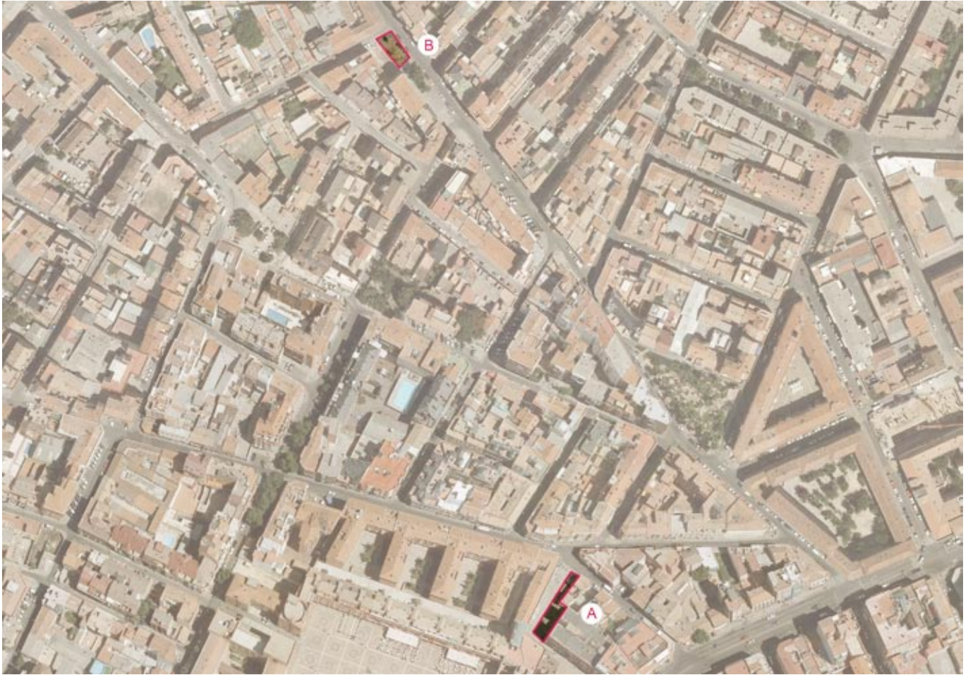
Parcela en calle Capitán Blanco Argibay, nº 15 (A) de propiedad municipal permutada para obtener otra en calle Pinos Alta, nº 55 y 57 (B) para apertura de viario, (Tetuán)