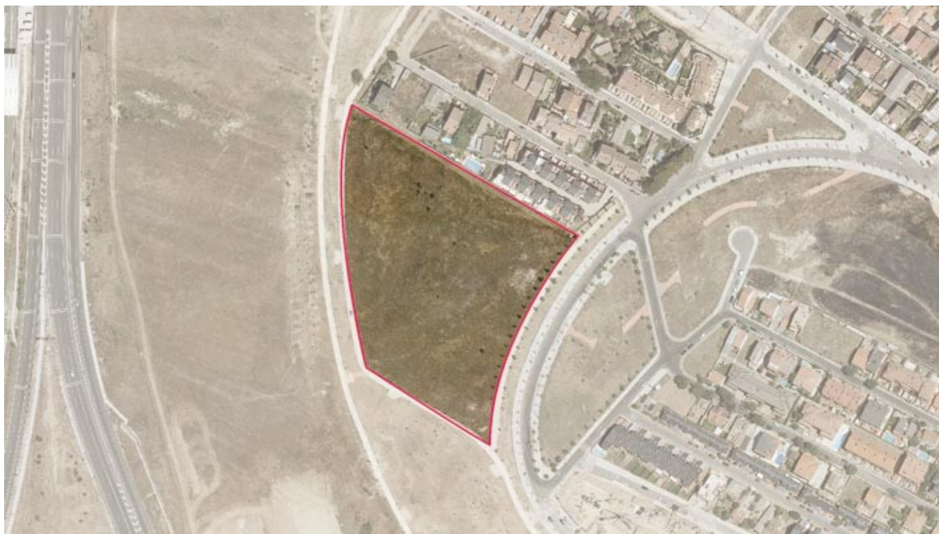
Autorización de ocupación de la parcela DCD/UZP 1.01. "Ensanche de Barajas" para la construcción de un equipamiento deportivo