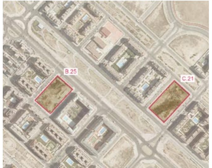
Autorización de ocupación de las parcelas B-25 Y C-21 en la UZI 0.08 "Las Tablas" para la construcción de un equipamiento educativo y un equipamiento cultural, respectivamente