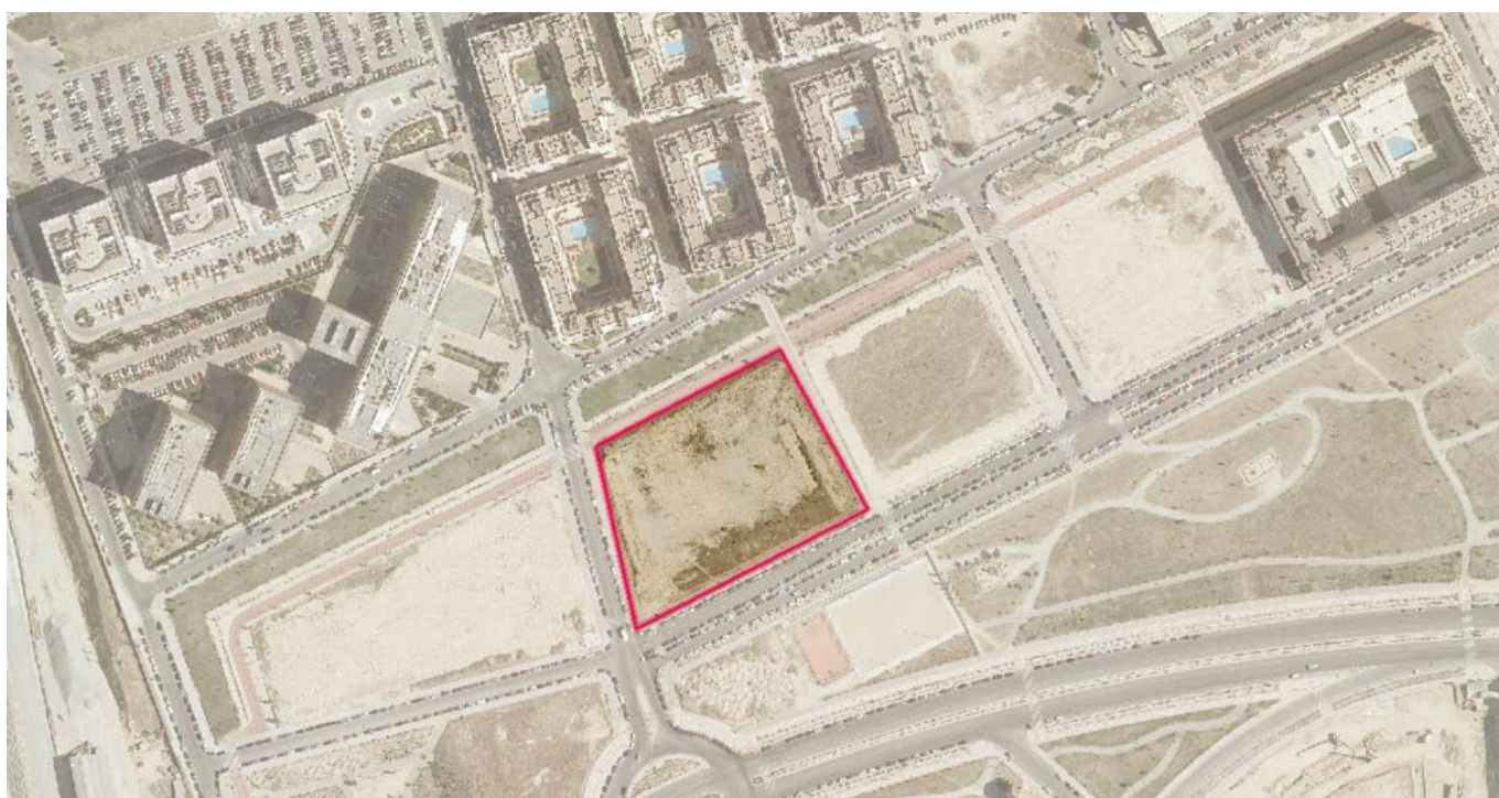
Parcela C.1A/UZI 0.08 “Las Tablas” transmitida en aportación de capital a la EMVS para la construcción de viviendas