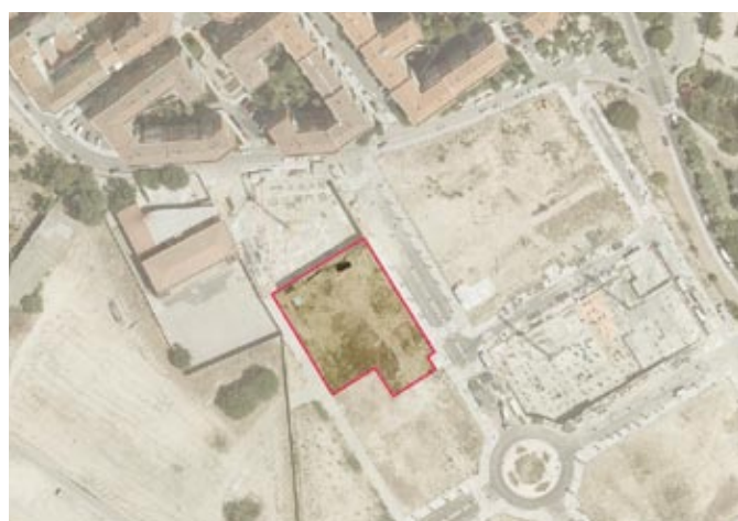
Parcela RC-A6 APR 17.10 "Los Rosales" cedida a la EMVS para la construcción de viviendas en régimen de protección pública