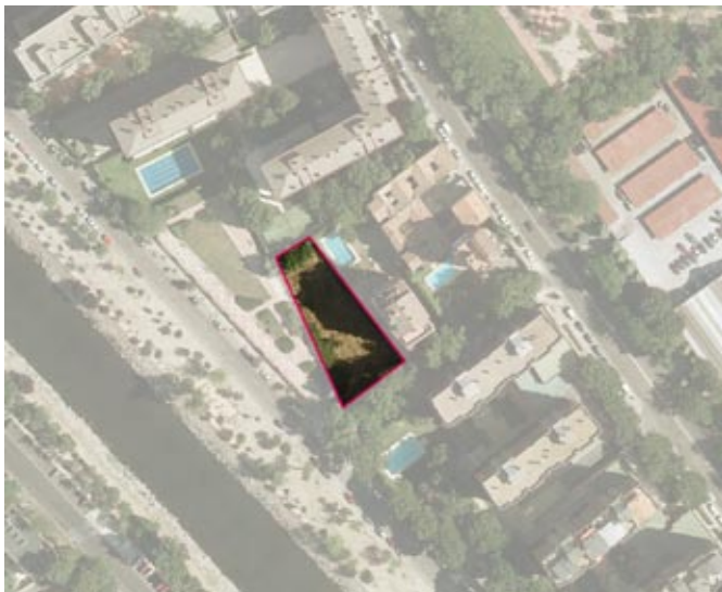
Autorización de ocupación de la parcela en Avda. de Valladolid 49B (Moncloa-Aravaca), para la construcción de un equipamiento educativo