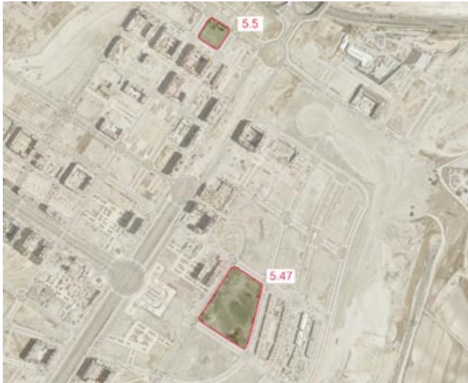
Autorización de ocupación de las parcelas 5.47 para la construcción de un centro deportivo y 5.5 para la construcción de un centro educativo, ambas en el UZP 1.03, "Ensanche de Vallecas"