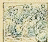
58 Pelo de la gracia en el pelo de la gracia.