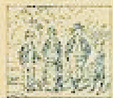
53 Pelo de la gracia en el pelo de la gracia.