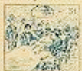
51 Pelo de la gracia en el pelo de la gracia.