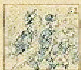
52 Pelo de la gracia en el pelo de la gracia.