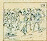
59 Pelo de la gracia en el pelo de la gracia.