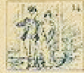
34 Pelo de la gracia en el pelo de la gracia.