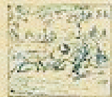
54 Pelo de la gracia en el pelo de la gracia.