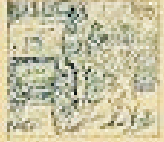
37 Pelo de la gracia en el pelo de la gracia.