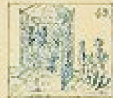
49 Pelo de la gracia en el pelo de la gracia.