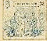
38 Pelo de la gracia en el pelo de la gracia.