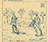
31 La gracia de la gracia y para los brazos.

NOTA - EL FANJUL EXPRESS DE LA CRUZ - Avenida de la Cruz