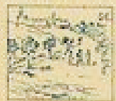
56 Pelo de la gracia en el pelo de la gracia.