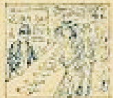
47 Pelo de la gracia en el pelo de la gracia.