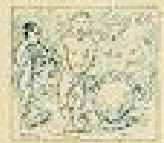
60 Pelo de la gracia en el pelo de la gracia.

Depósito - FANJUL - RIVERO EXPRESS de la CRUZ - Excmo. y Honorable patentes - Solís 680 - Casa 20 - 1892