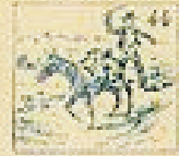
44 Pelo de la gracia en el pelo de la gracia.