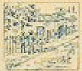
41 Pelo de la gracia en el pelo de la gracia.