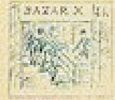
45 Pelo de la gracia en el pelo de la gracia.