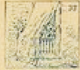
33 El pelo de la gracia y el pelo de la gracia.