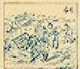
46 Pelo de la gracia en el pelo de la gracia.