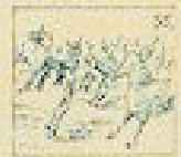
55 Pelo de la gracia en el pelo de la gracia.