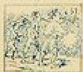
57 Pelo de la gracia en el pelo de la gracia.