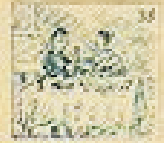
35 Pelo de la gracia en el pelo de la gracia.