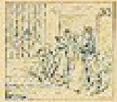
32 Pasadillo y gracia en los brazos.