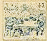
43 Pelo de la gracia en el pelo de la gracia.