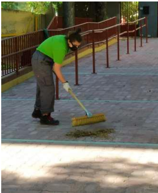
Acondicionamiento de espacios públicos