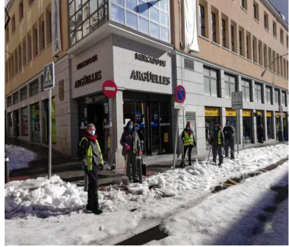
Campañas de limpieza de nieve y hielo