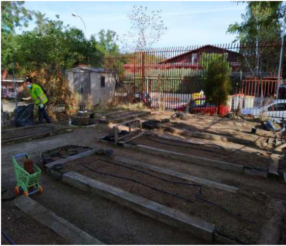
Actuaciones en huertos urbanos