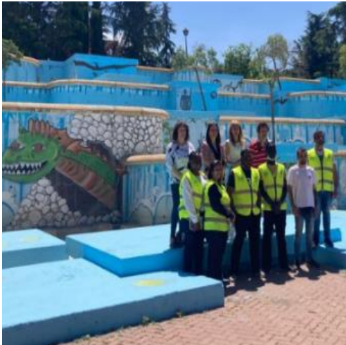
Arreglo de gradas y fuente en el Parque de las Cataratas