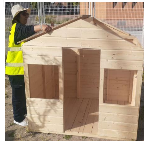
Caseta de juegos para la Escuela Infantil La Revoltosa