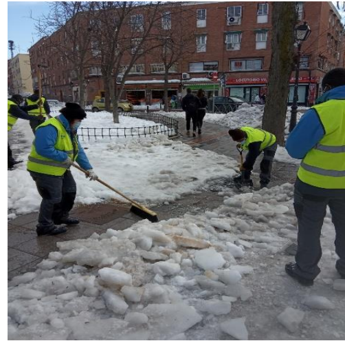
Limpieza de nieve en el Hospital Virgen de la Torre