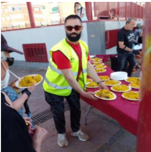
Apoyo a la Marcha de Mayores "Villa de Vallecas"