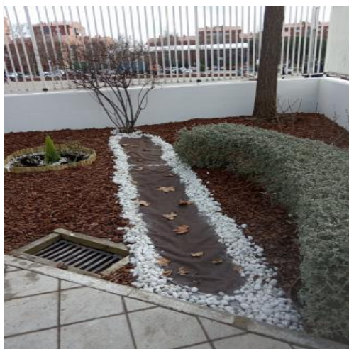
Mejora de las zonas verdes en la Escuela Municipal de Música Villa de Vallecas