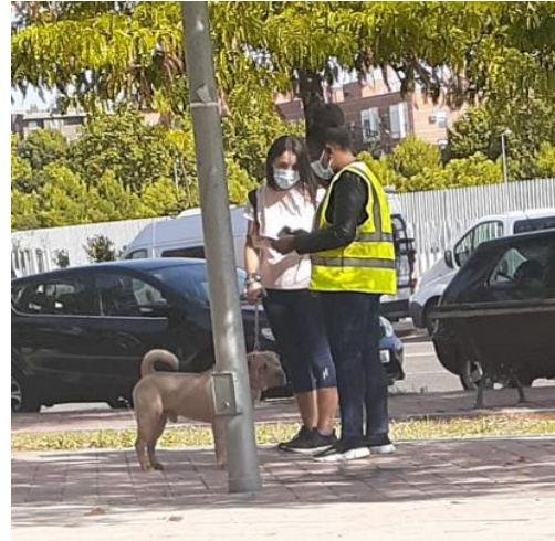
Campaña de concienciación sobre excrementos caninos