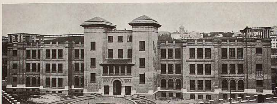
Grupo escolar «Menéndez Pelayo» (En la calle de Méndez Alvaro)