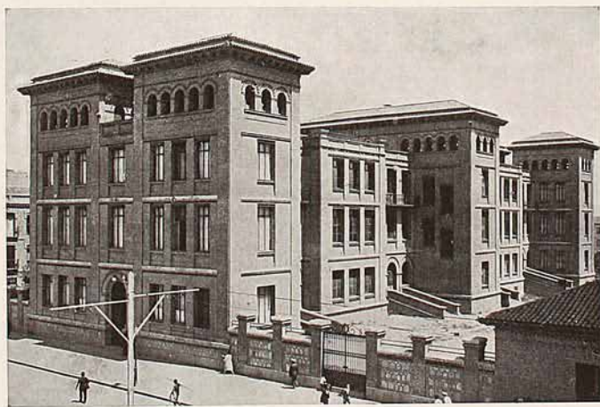
Grupo escolar «Jaime Vera» (En la calle de Bravo Murillo)