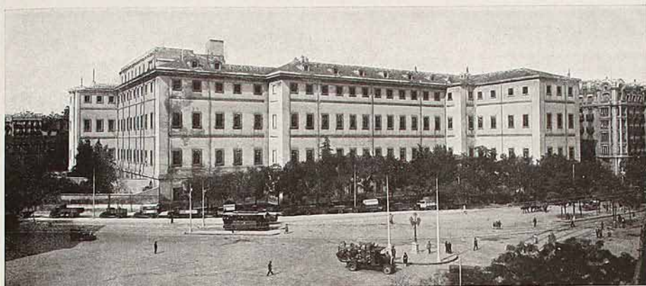
Hospital Provincial (Desde la casa núm. 1 del Paseo de las Delicias)