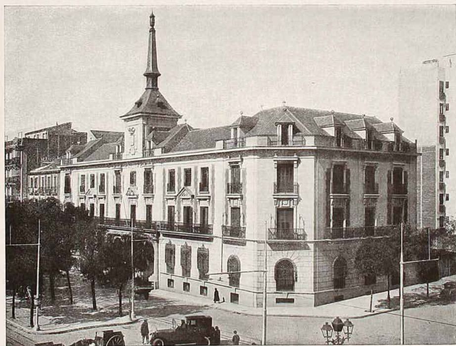
Edificio municipal del Distrito de la Universidad (En él se encuentra la Casa de Socorro)