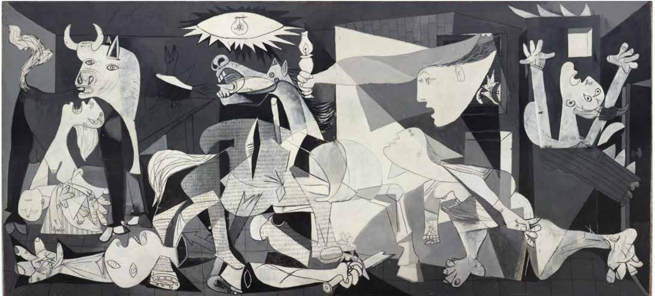
Guernica. 1936. Pablo Picasso © Sucesión Pablo Picasso. VEGAP, Madrid, 2017