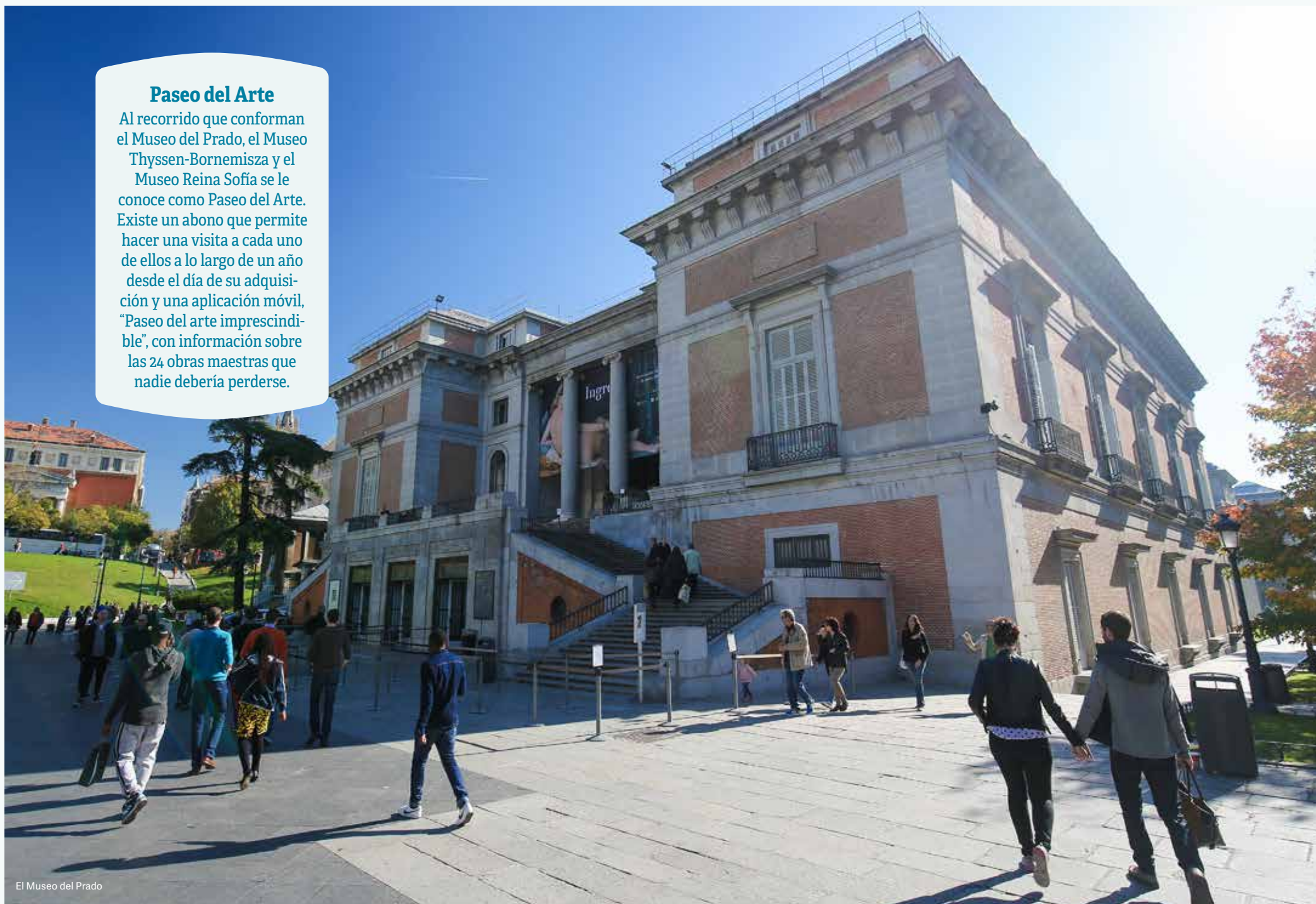
El Museo del Prado

Al recorrido que conforman el Museo del Prado, el Museo Thyssen-Bornemisza y el Museo Reina Sofía se le conoce como Paseo del Arte. Existe un abono que permite hacer una visita a cada uno de ellos a lo largo de un año desde el día de su adquisición y una aplicación móvil, "Paseo del arte imprescindible", con información sobre las 24 obras maestras que nadie debería perderse.