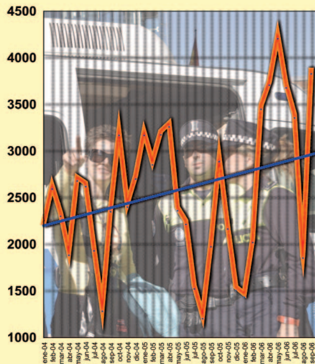
Elaboración propia sobre datos de Policía Municipal de Madrid

mación al ciudadano y de prevención de la delincuencia y conflictividad.