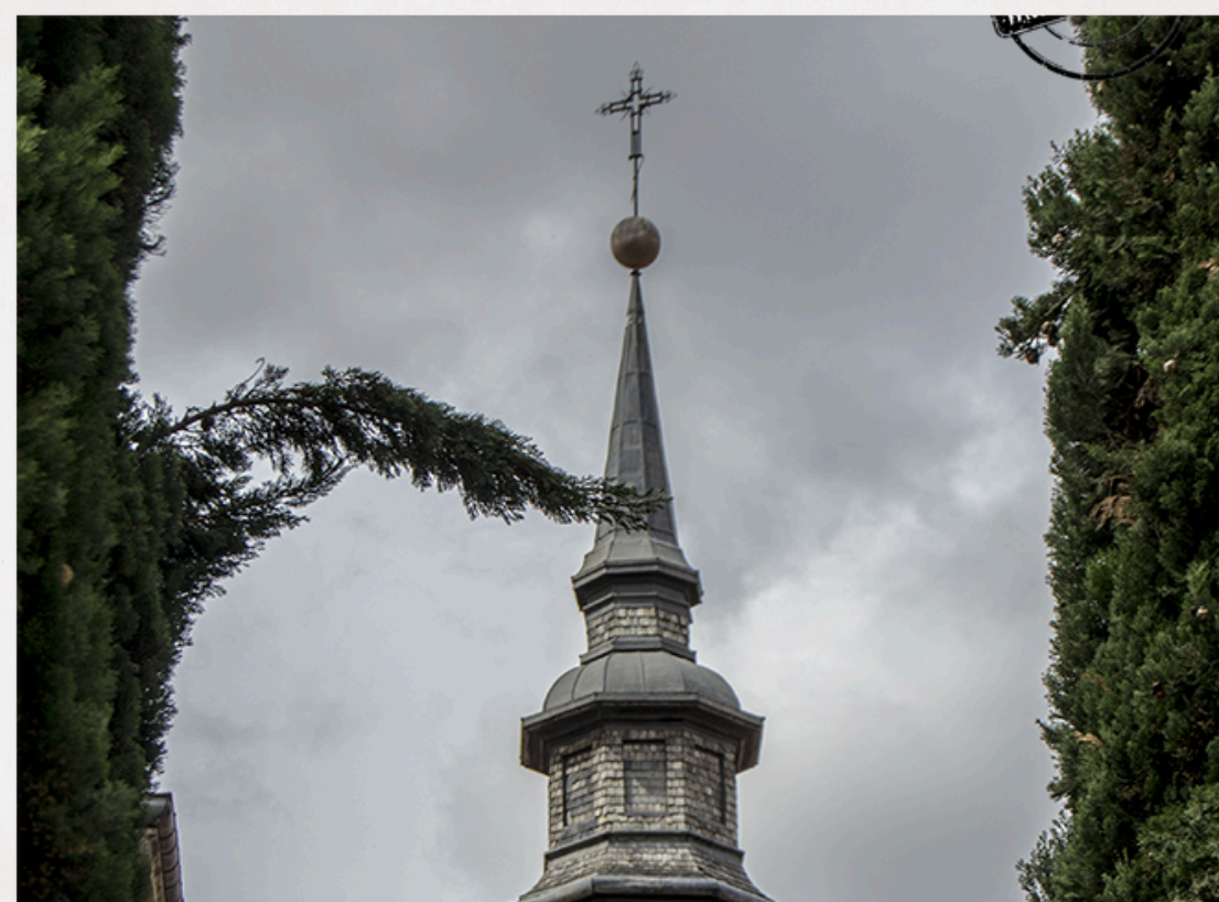
VISITA CULTURAL: CAPILLA CRISTO DE LOS DOLORES