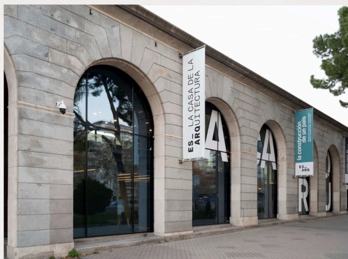
VISITA CULTURAL: CASA DE LA ARQUITECTURA