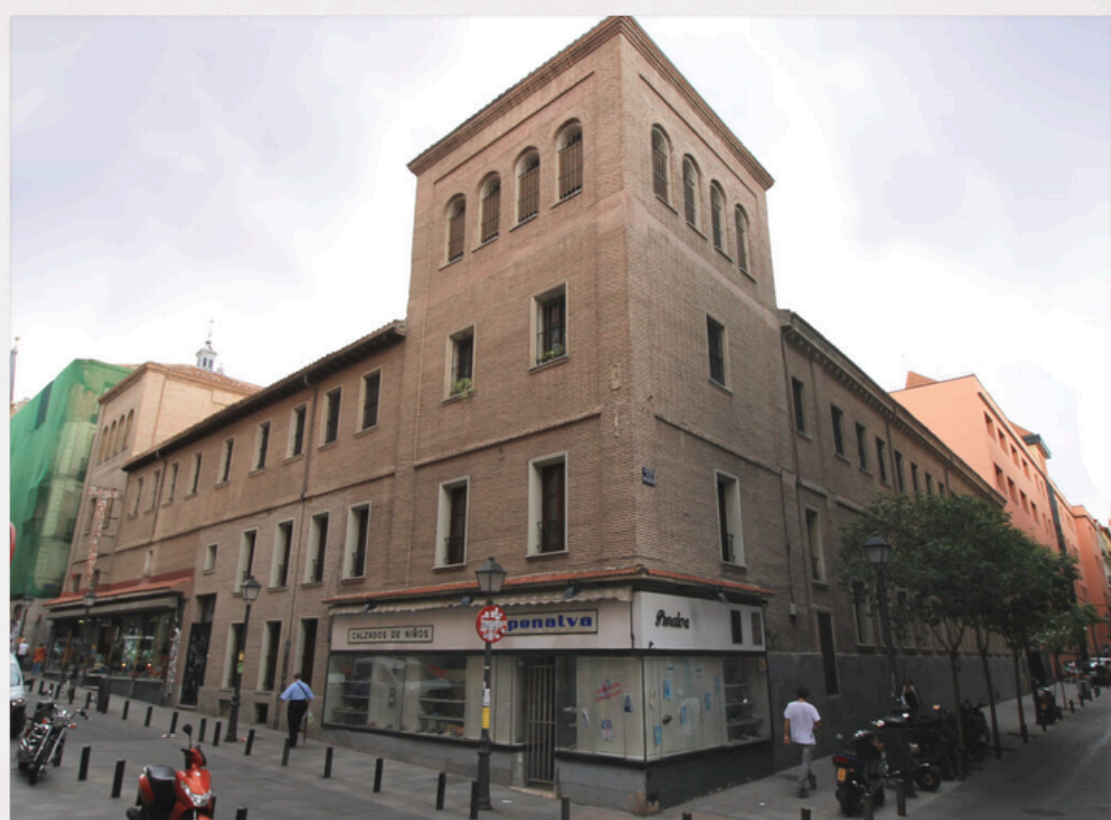
VISITA CULTURAL: MONASTERIO SAN PLACIDO

https://madrid.es/go/fuencarralelpardo.mayores