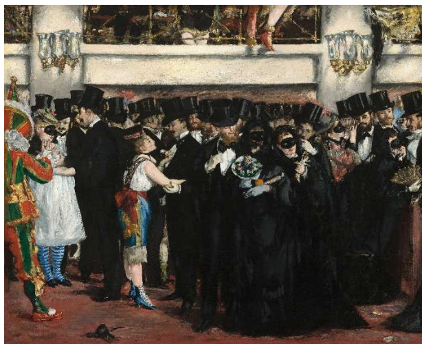
Baile de Máscaras en la Ópera, Edouard Manet