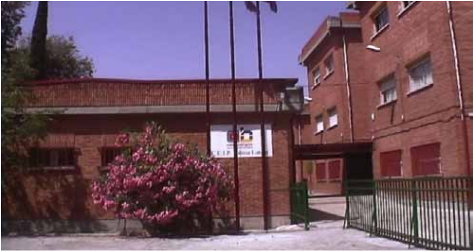
Colegio Público Doctor Tolosa Latour , Calle Asturianos 1. Inversión de 120.000€.