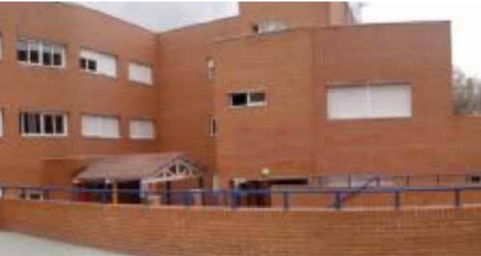
Colegio Público Fray Junípero Serra , Camino de Valderribas 120. Inversión de 70.885,49€.