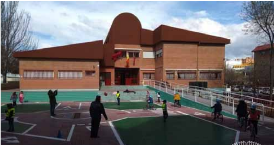
Colegio Público Asturias , Calle Asturianos 2. Inversión de 99.978,51€.