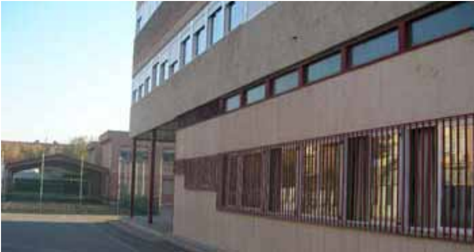
Colegio Público Giner de Los Ríos , Calle Membezar 25. Inversión de 49.984,66€.