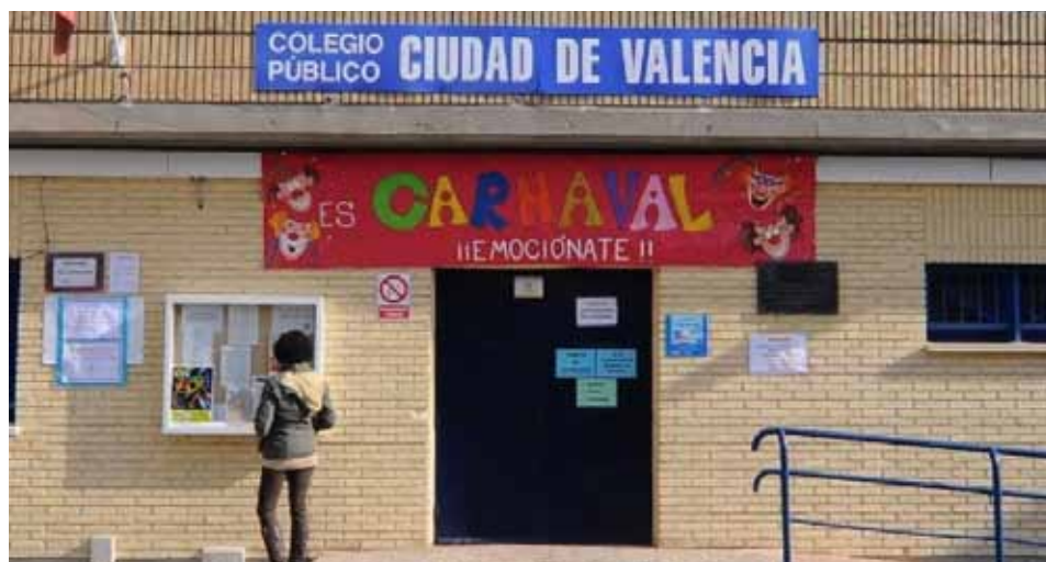
Colegio Público Ciudad de Valencia , Calle Cerro Almodóvar 11. Inversión de 189.364€.