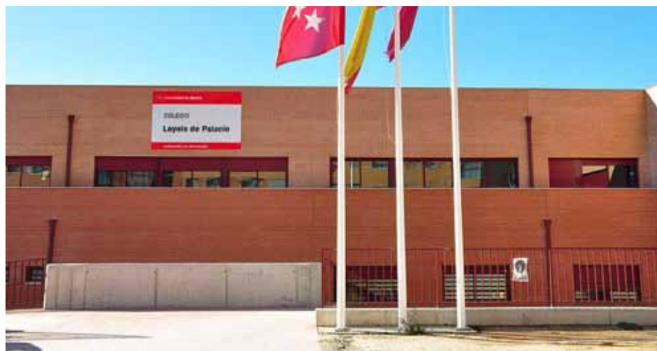
Colegio Público Loyola de Palacios , Calle Embalse de Navacerrada 60. Inversión de 194.816€.