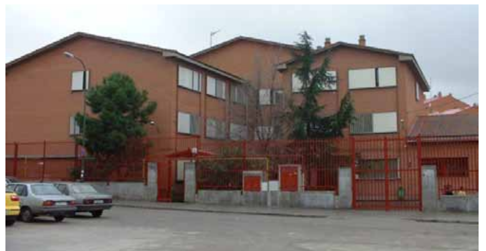
Colegio Público Blas de Otero , Calle de Puente de Larra 34. Inversión de 191.069€.