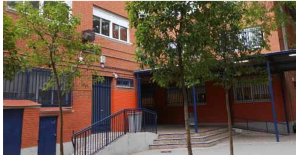
Colegio Público Francisco Fatou , Calle Camino de la suerte 23. Inversión de 409.627€.

En el año 2018 se van a realizar actuaciones en los Colegios Públicos de Villa de Vallecas por importe de 1.877.953,53€. De ellos 99.953,53€ corresponden al programa “Que Mole, Que Mole el patio de mi cole” que fue aprobado en los Presupuestos Participativos del año 2017. En Octubre están finalizadas o en proceso de término las obras de remodelación por importe de 1.348.953,53€ que se han realizado en los C.E.I.P: Blas de Otero, Ciudad de Valencia, El Quijote, Francisco Fatou, Honduras, Juan Gris, Loyola de Palacios, Juan de Herrera, José Echegaray y Agustín Rodríguez Sahagún , y en las Escuelas Infantiles: La Revoltosa y Los Sobrinos del Capitán Grant .