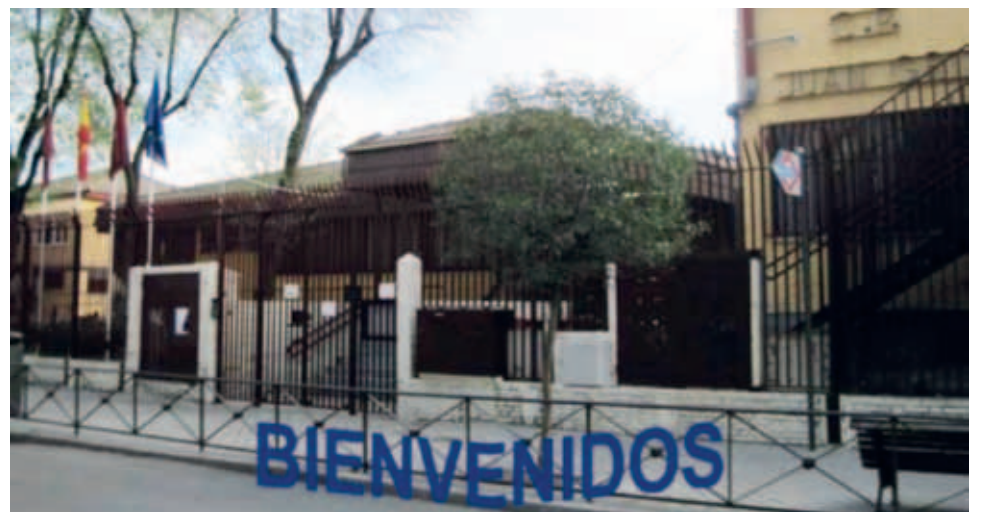
Colegio Público Juan Gris , Calle Muela de San Juan 31. Inversión de 196.376€.