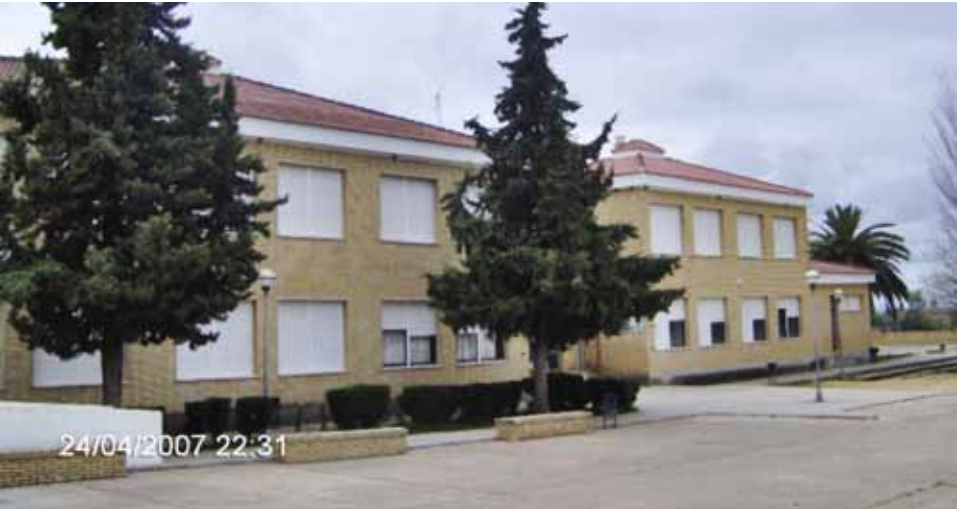
Colegio Público Virgen del Cerro , calle Mohernando 1. Inversión de 71.224,45€.

En el año 2018 se van a realizar actuaciones en los Colegios Públicos de Puente de Vallecas por importe de 1.684.140,88€. En Octubre están finalizadas o en proceso de conclusión, obras de remodelación por importe de 924.358,85€ en los siguientes Colegios Públicos: Virgen del Cerro, Mesoneros Romanos, José Mª Pereda, Santo Domingo, Amos Acero, Giner de los Ríos, Manuel Siurot, San Pablo I, Doctor Tolosa Latour, Fray Junípero Serra, Asturias, La Rioja, Aragón y Agustina Díez. ■