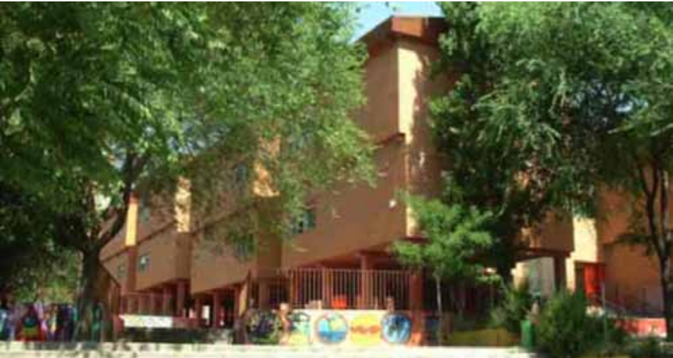
Colegio Público Aragón , Calle Rafael Alberti 2. Inversión de 135.406,71€.