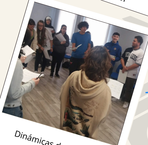
Dinámicas de grupo