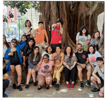
Convivencia en Málaga