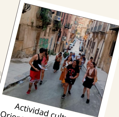
Actividad cultural: Orientación en la ciudad