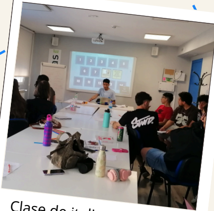
Clase de italiano y cultura italiana