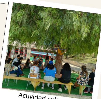
Actividad cultural: Conociendo la historia de la mafia siciliana