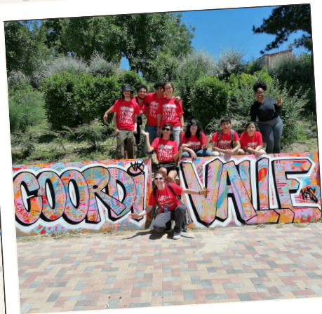
Práctica de animación en el Día Infantil y Juvenil de Vallecas