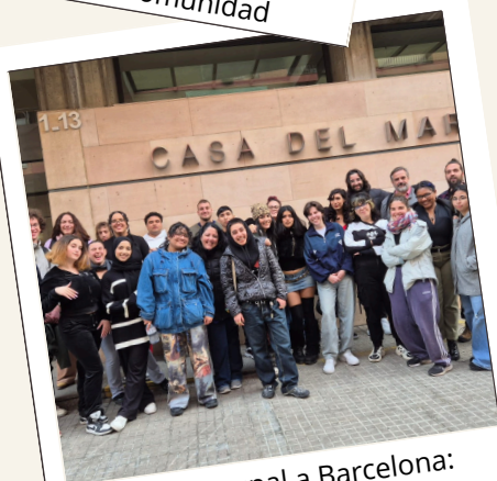
Salida grupal a Barcelona: Intercambio de experiencias con Catalunya Voluntaria