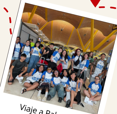
Viaje a Palermo