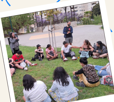
Sesión del Curso de monitor/a de tiempo libre

Fase de preparación y formación (08/04/2024 - 05/07/2024)