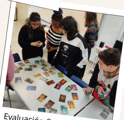
Evaluación final del proyecto