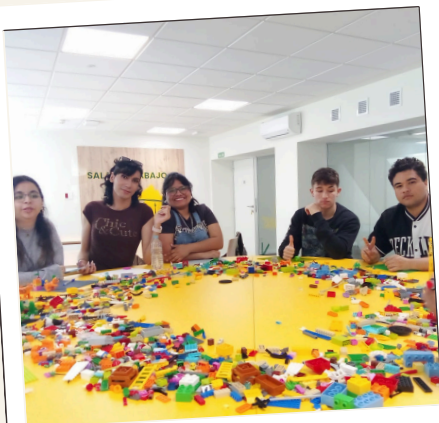
Sesión formativa: Trabajo en equipo