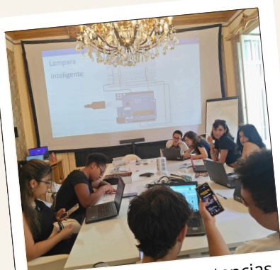
Formación en competencias digitales y electrónicas