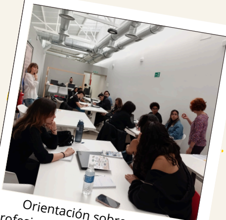
Orientación sobre salidas profesionales del sector animación y servicios a la comunidad