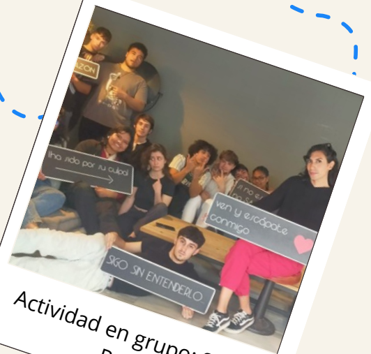
Actividad en grupo: Scape Room