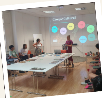
Formación a la llegada