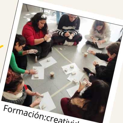
Formación: creatividad y emociones