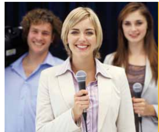
IMAGEN Y SONIDO

Alguno de los siguientes requisitos: (1) Bachillerato o nivel académico equivalente. (2) F.P. de Grado Medio o nivel académico equivalente. (3) Experiencia laboral acreditable en el área profesional. En todos los casos con conocimientos a nivel de usuario avanzado del sistema operativo e Internet. Recomendable poseer conocimientos de HTML.