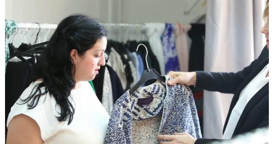
La ropa y el maquillaje son donados por grandes empresas