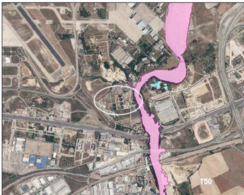
Llanura de inundación corresponde al periodo de retomo de 50 años (T50)