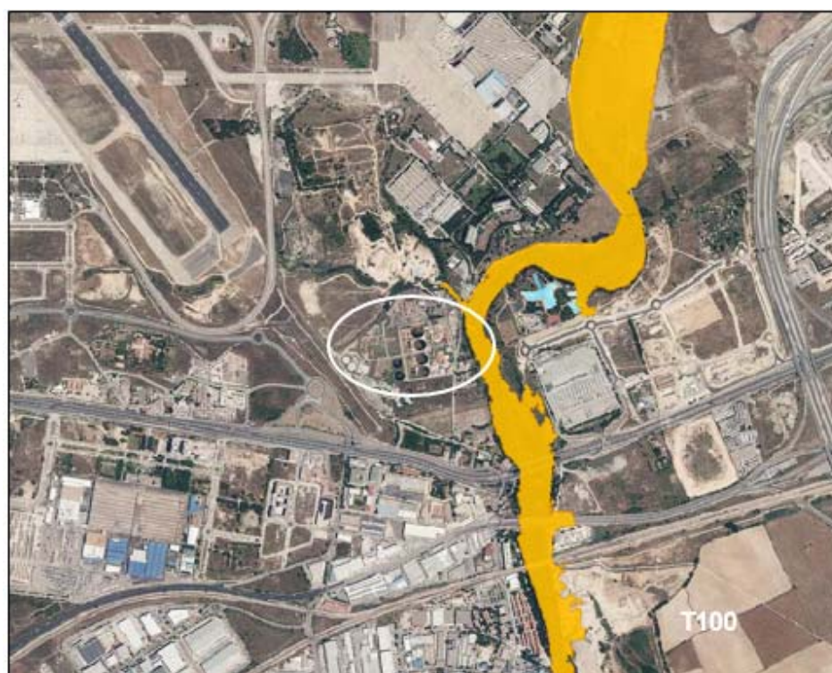
Llanura de inundación corresponde al periodo de retomo de 100 años (T100)