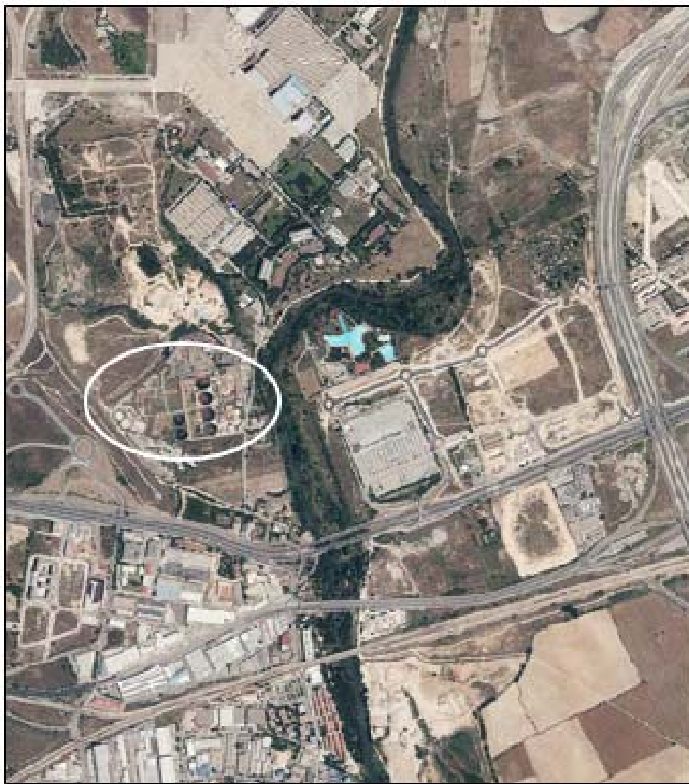
Emplazamiento de la ERAR de Rejas

De acuerdo con el inventario de zonas inundables, la parcela de la ERAR de Rejas no se encuentra en una llanura de inundación de origen. A continuación, se muestran las llanuras de inundación asociadas a distintos periodos de retorno.