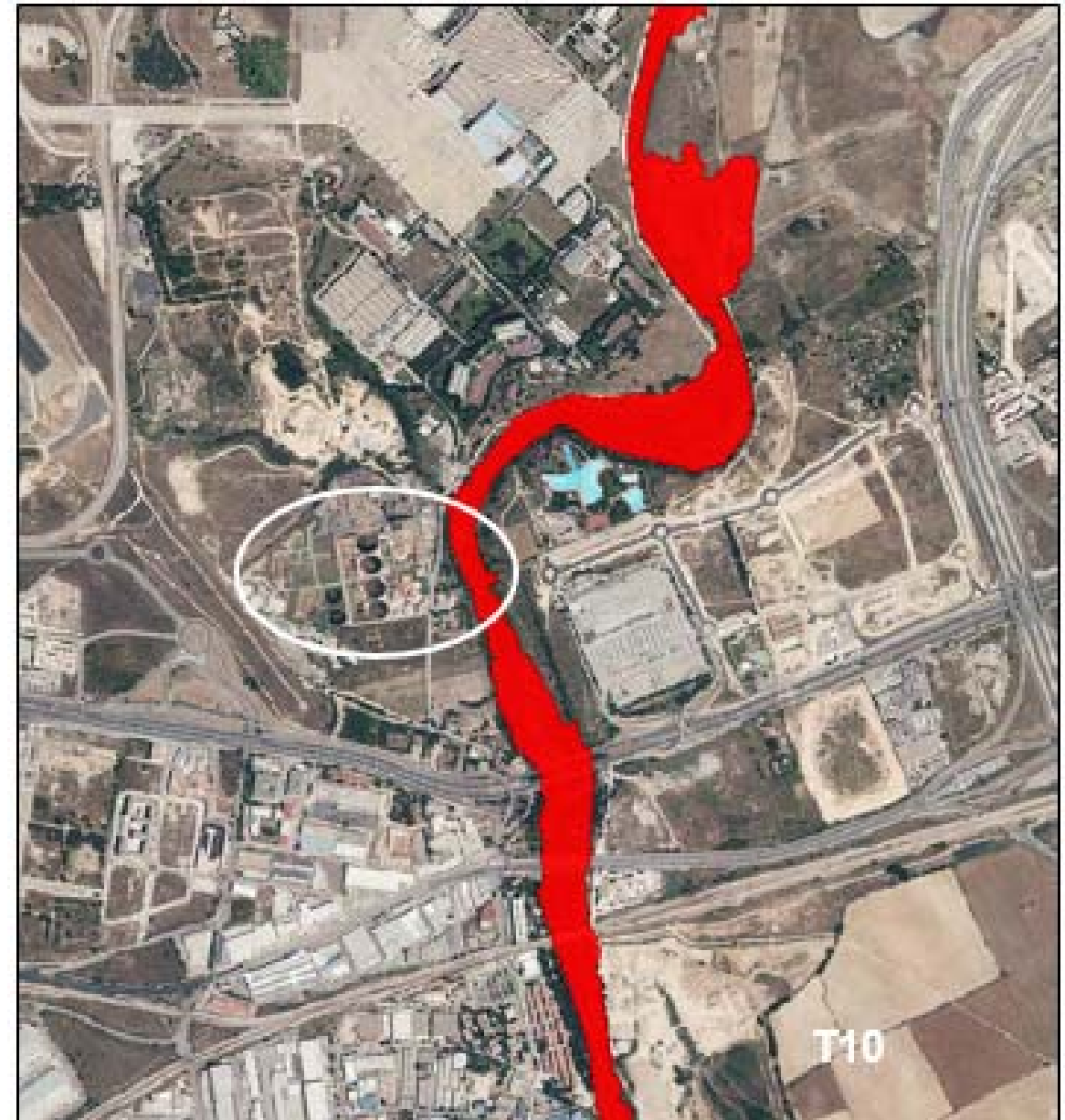
Llanura de inundación corresponde al periodo de retomo de 10 años (T10)