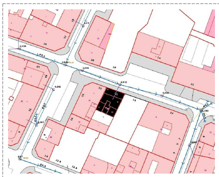
Plano de situación con red municipal.