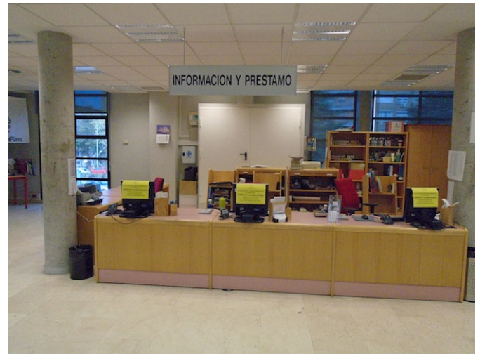
Mostrador de atención