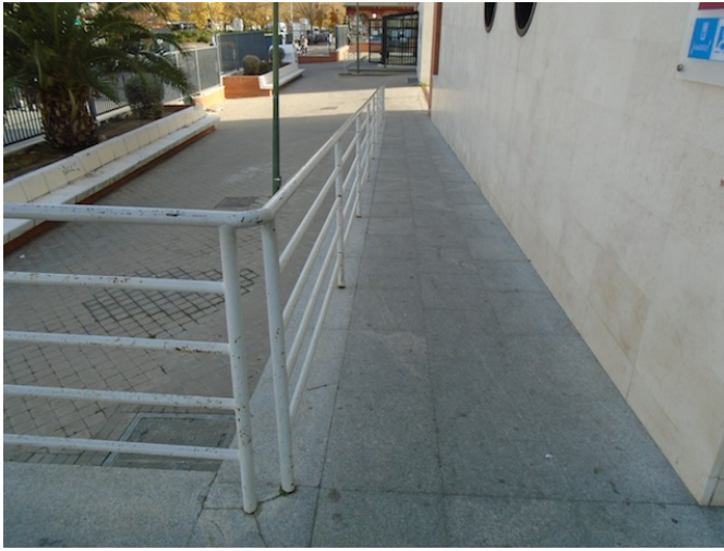
Rampa de acceso a la biblioteca