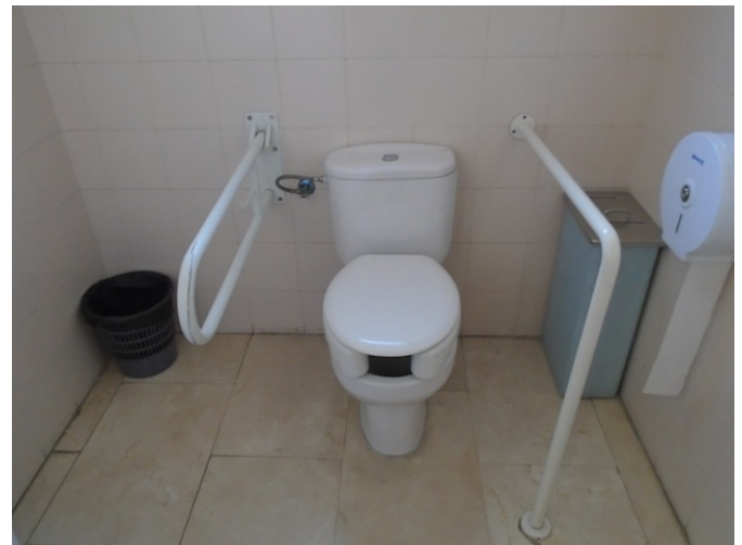
Aseo común adaptado