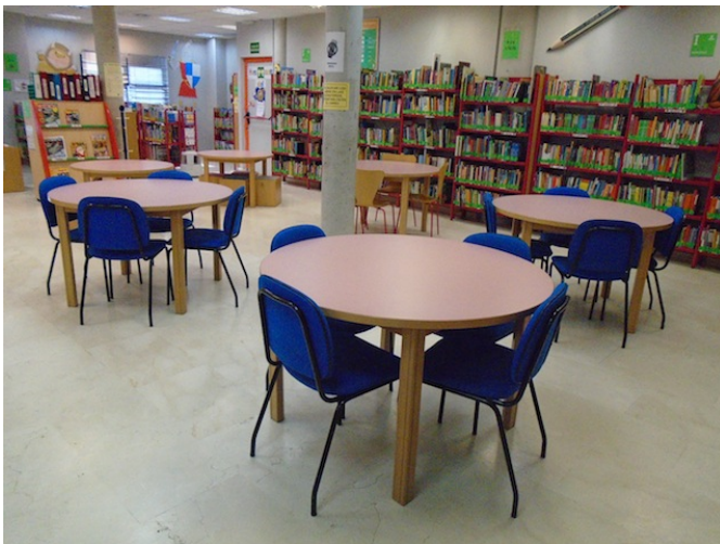
Zona de biblioteca infantil