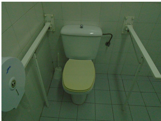
Aseo común adaptado