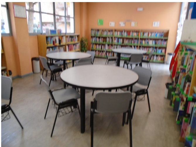
Zona biblioteca infantil