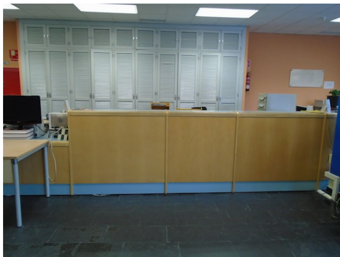
Mostrador de atención