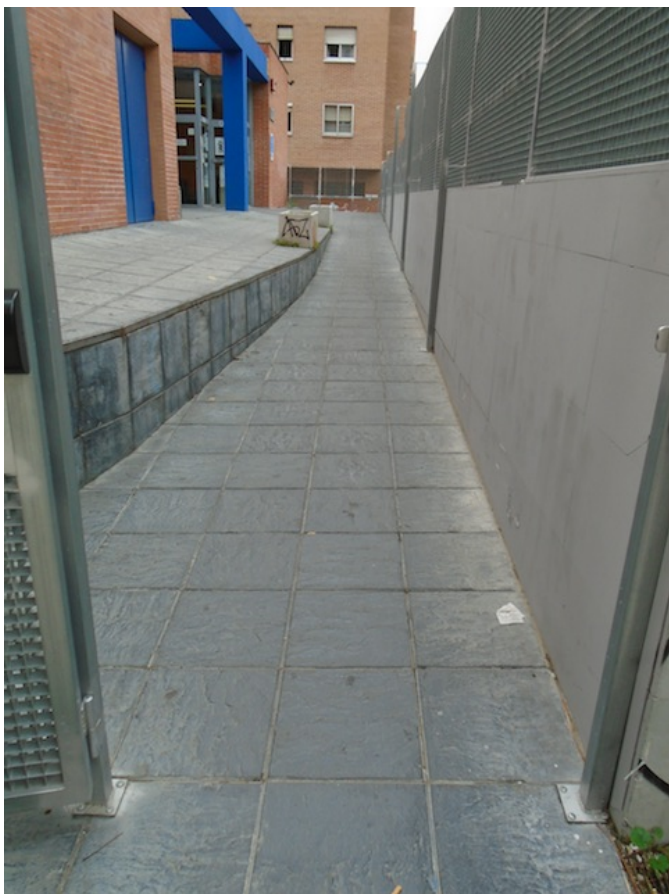
Rampa de acceso a la biblioteca