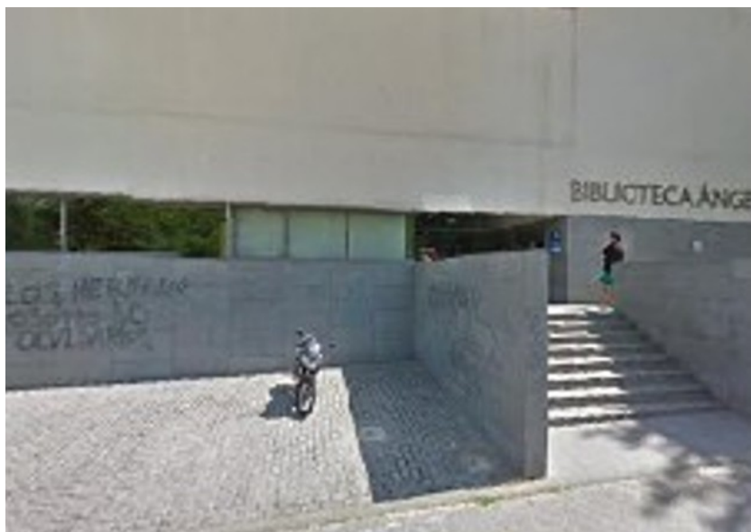
Fachada de la biblioteca