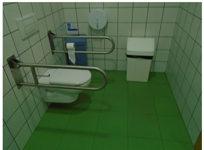
Aseo común adaptado