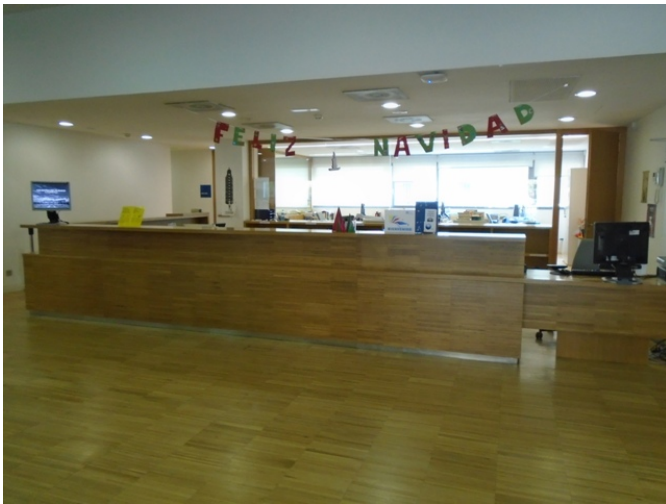
Mostrador de atención