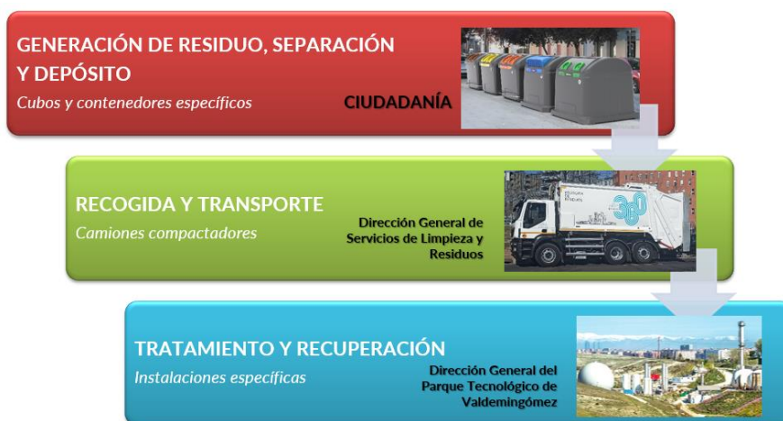
Proceso básico de la gestión de residuos en la ciudad de Madrid

Con este objetivo, el Ayuntamiento de Madrid trabaja para minimizar los residuos producidos, y mejorar el aprovechamiento de los que se generan, reduciendo su impacto ambiental. La ciudad de Madrid cuenta con un conjunto de infraestructuras de recogida, transporte, tratamiento y valorización de los residuos domésticos y comerciales que figura entre los más completos y avanzados de Europa.