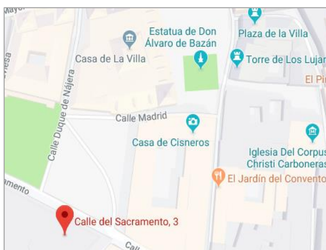
OAIC C/ Sacramento, 3