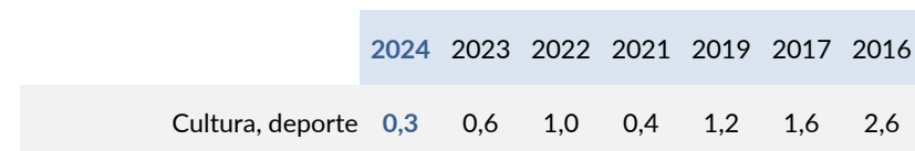
Problemas citados entre los tres principales

Unidad: porcentaje (representado el porcentaje >0,5% en problema citado en primer lugar)