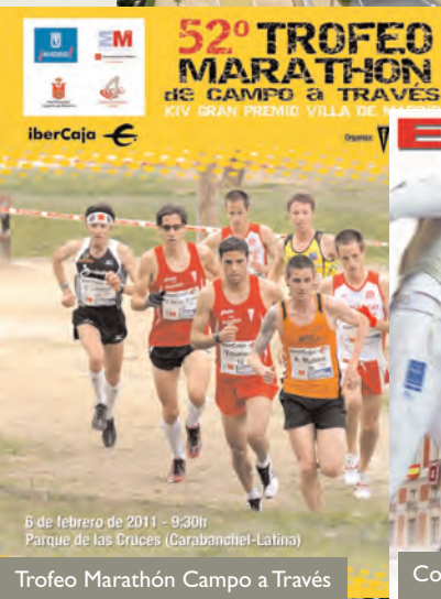
6 de febrero de 2011 - 9:30h Parque de las Cruces (Carabanchel-Latina)