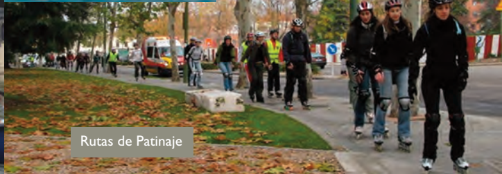
Rutas de Patinaje