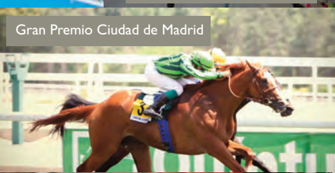
Gran Premio Ciudad de Madrid