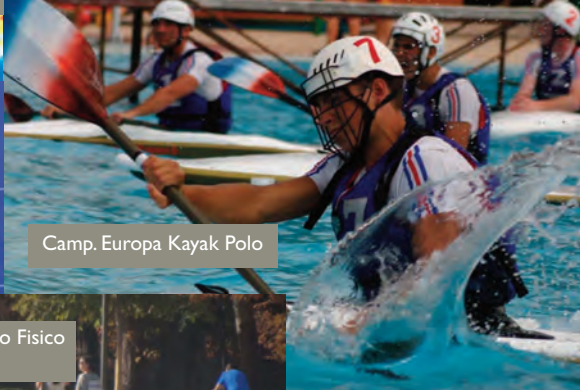
Camp. Europa Kayak Polo