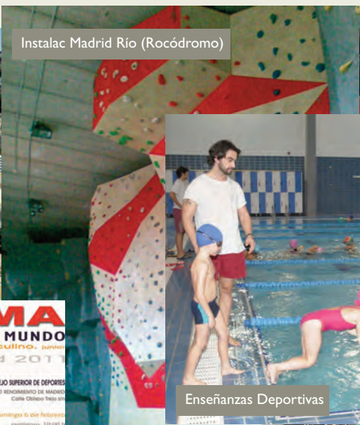
Instalac Madrid Río (Rocódromo)