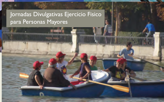
Jornadas Divulgativas Ejercicio Físico para Personas Mayores