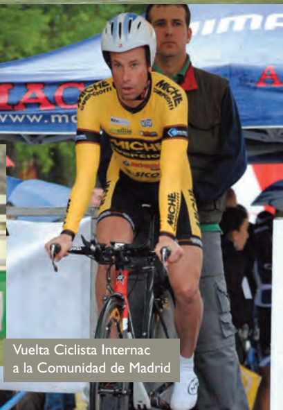
Vuelta Ciclista Internac a la Comunidad de Madrid