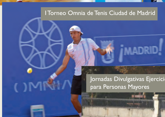
I Torneo Omnia de Tenis Ciudad de Madrid