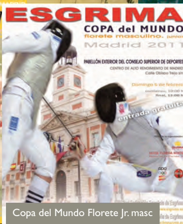
Copa del Mundo Florete Jr. masc