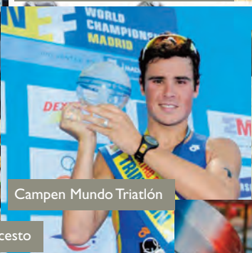
Campen Mundo Triatlón