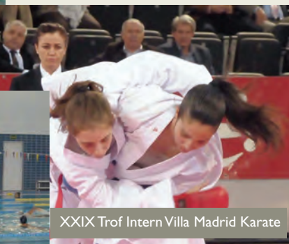
XXIX Trof Intern Villa Madrid Karate