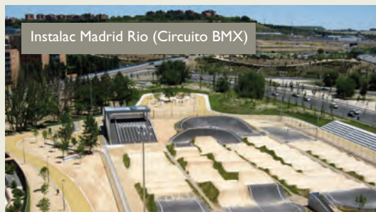
Instalac Madrid Río (Circuito BMX)