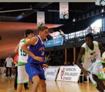
III Torneo Jr Masc Interciudades Baloncesto