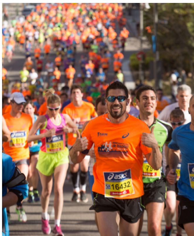
Medio Maraton Villa de Madrid