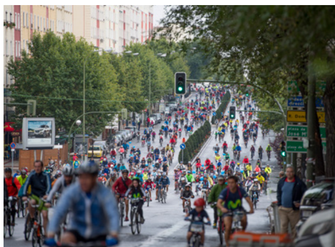
Fiesta de la Bicicleta