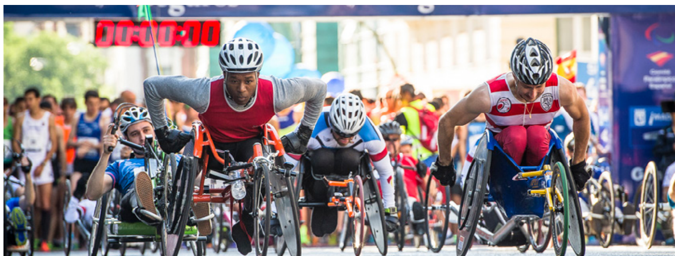
Carrera Liberty Madrid