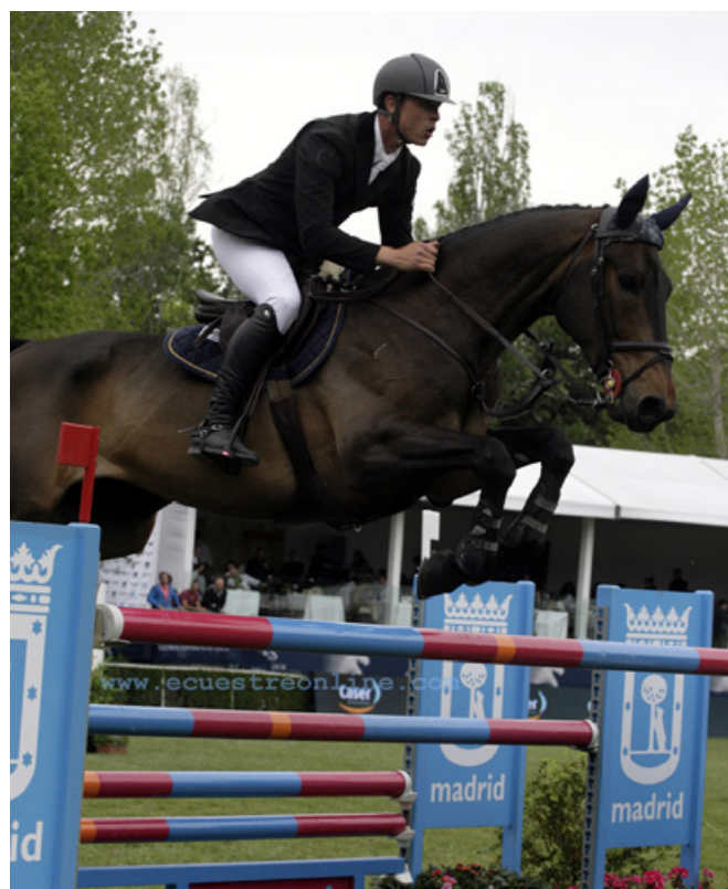
Concurso Internacional de Saltos