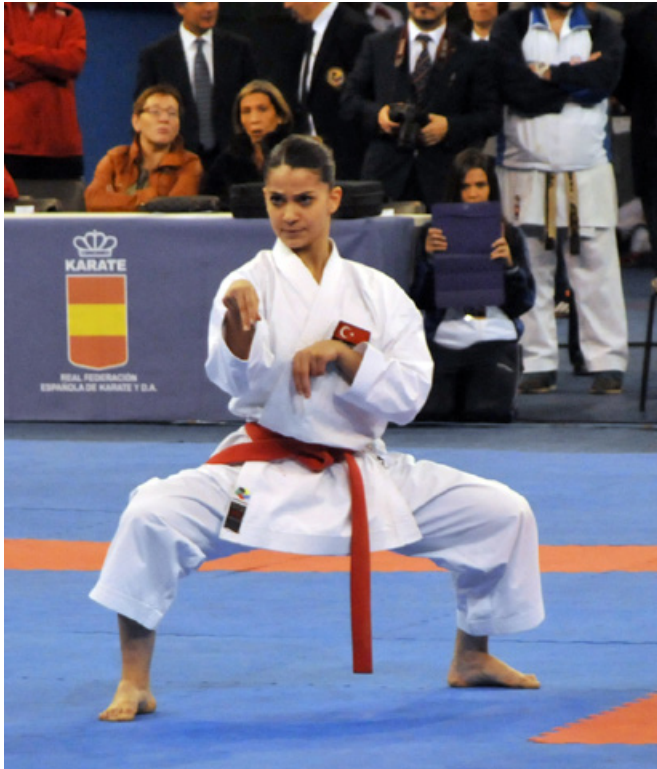
Villa de Madrid de karate