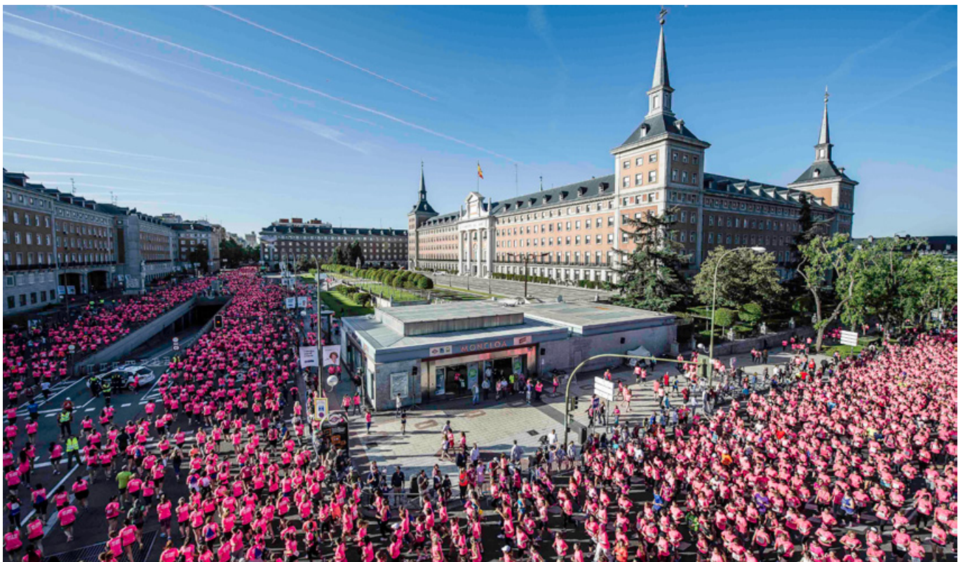
Carrera de la Mujer