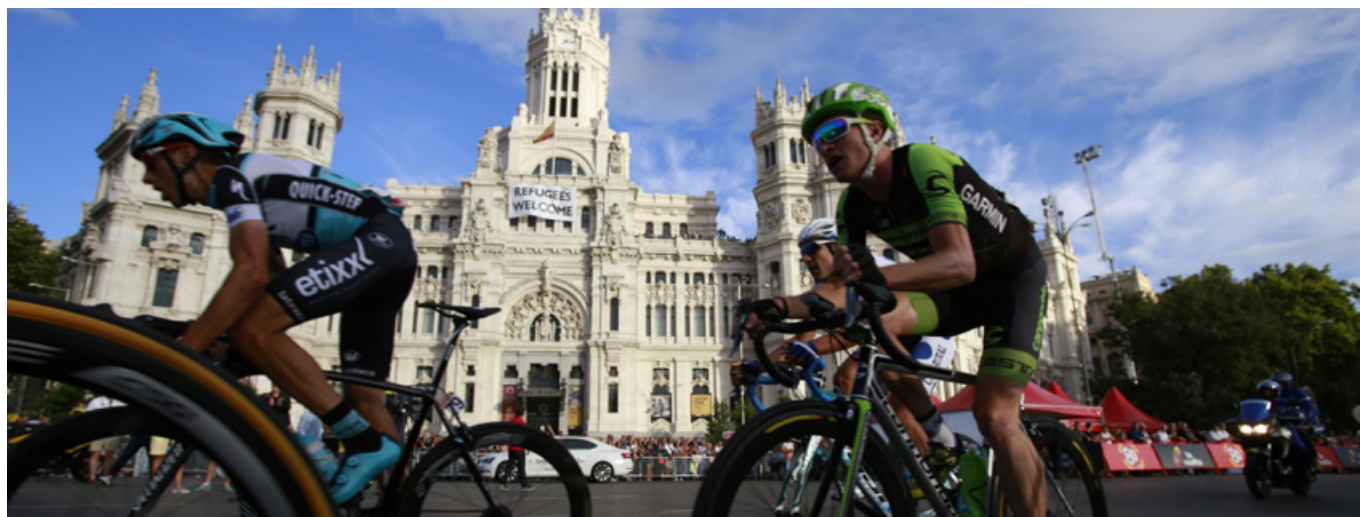
Vuelta Ciclista a España