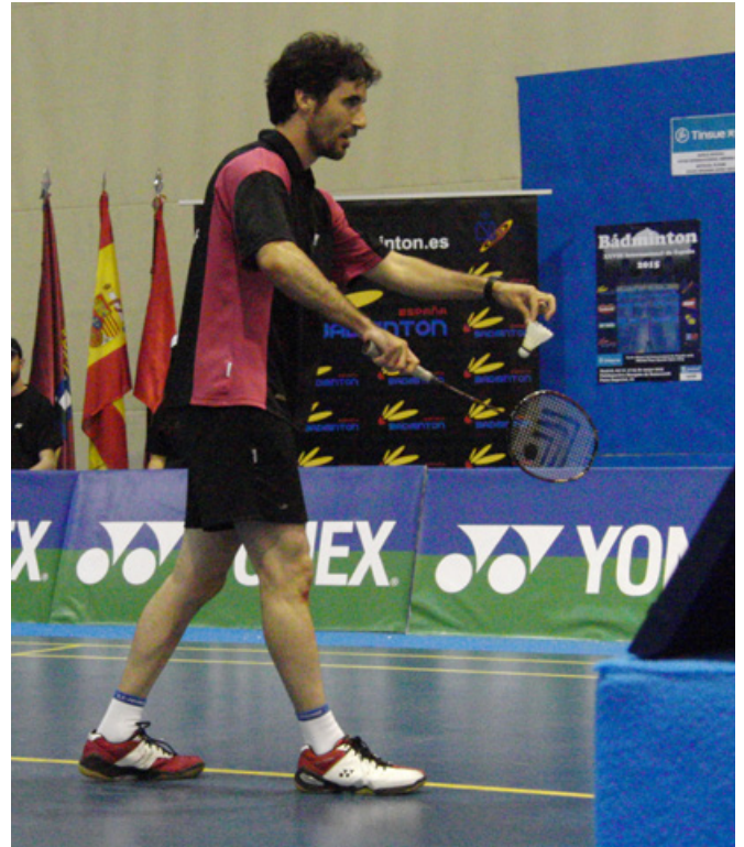
Torneo Internacional de badminton