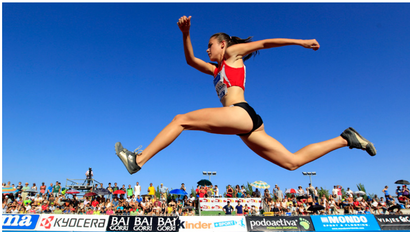
Meeting de Atletismo