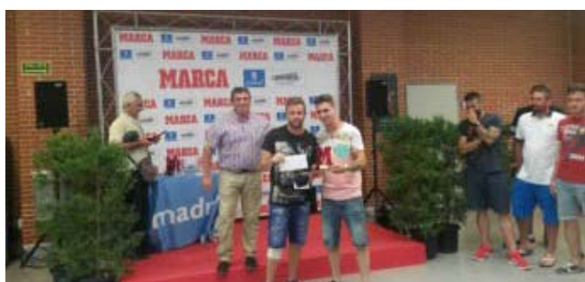
Equipo Campeón Masculino de Fútbol Sala: Gratis Film