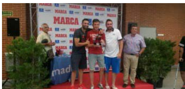
Equipo Campeón Masculino de Fútbol 7: San Dennis