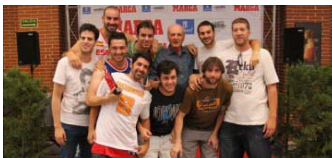
Equipo Campeón Masculino de Baloncesto: Manducazo