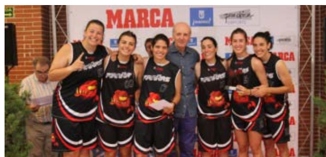
Equipo Campeón Femenino de Baloncesto: Pirañas