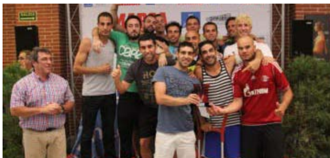
Equipo Campeón Masculino de Fútbol 11: Comando KT Kuen