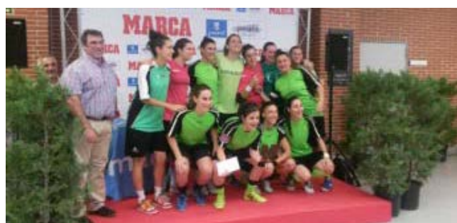
Equipo Campeón Femenino de Fútbol Sala: Las Cuscús