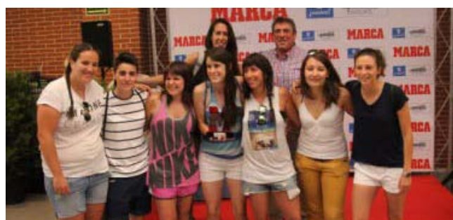
Equipo Campeón Femenino de Fútbol 7: Las Cochambres