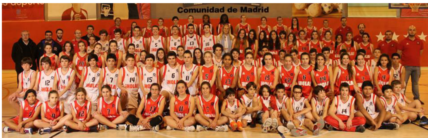
Club Deportivo CREF.