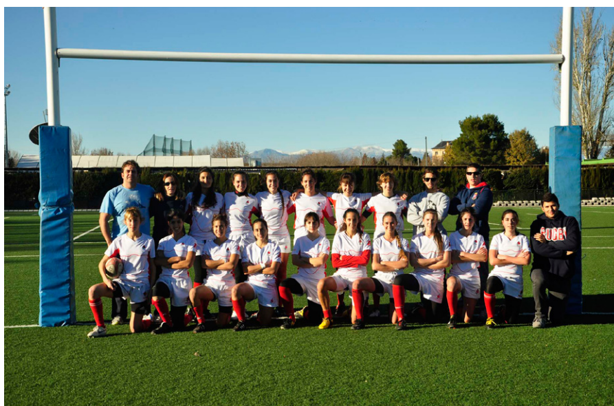
CD Arquitectura Equipo Senior Femenino.