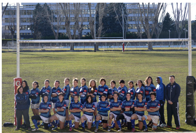
CR Complutense Cisneros.