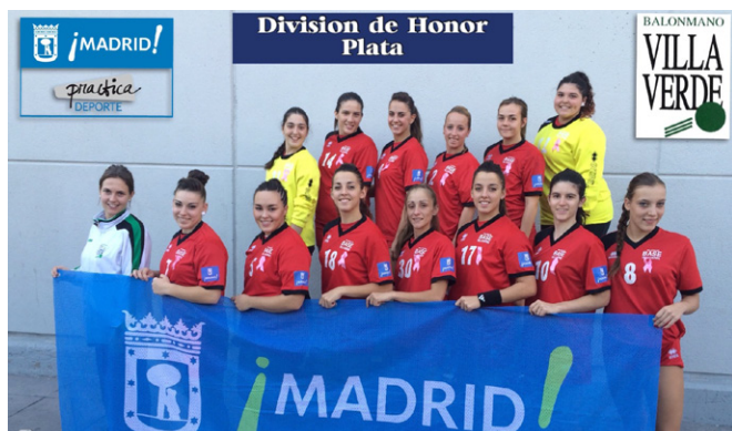
Balonmano Base Villaverde.