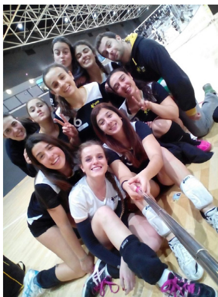
Voley Playa Madrid Juvenil.