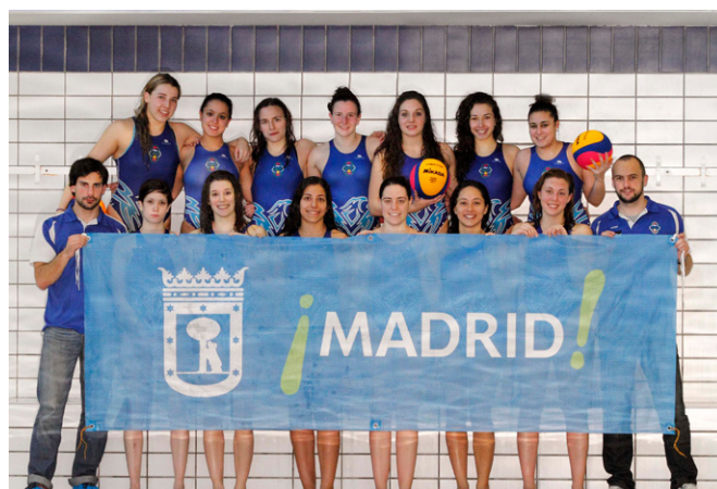
CN Cuatro Caminos.