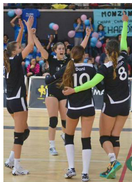
Club Voley Playa Madrid.