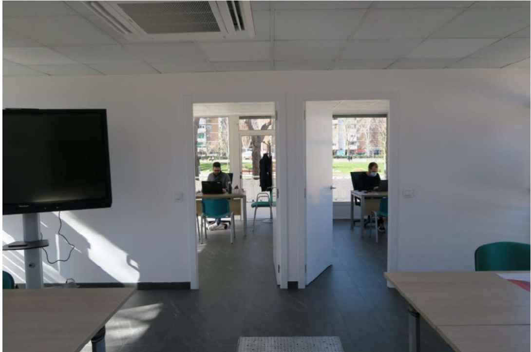
Interior de la Oficina de Vida Independiente