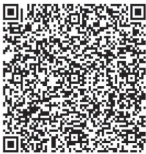
El Mago de Oz