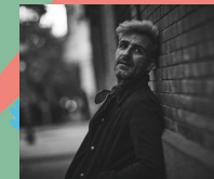
Sábado, 30 de mayo: 23:30 h FUNAMBULISTA