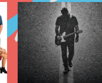
Viernes, 5 de junio: 23:30 h REVOLVER