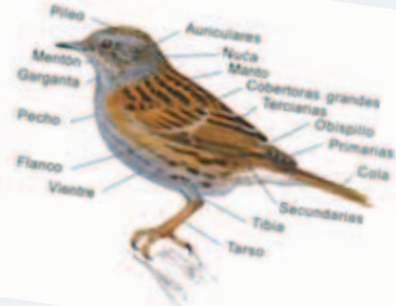
Partes de un ave

Y, finalmente, no hay que desanimarse si al principio no conseguimos identificar ninguna. Disfrutar de lo que vemos y escuchamos es de por sí una gran recompensa.