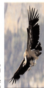
Buitre leonado (Gyps fulvus) en vuelo. Eduardo Ruiz Balarín