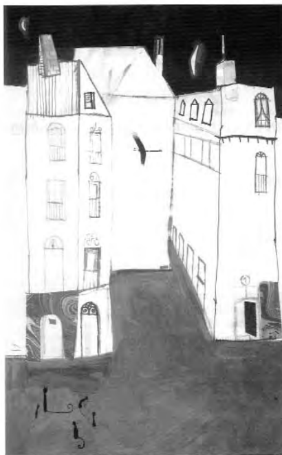
La ilustración de la portada y la decésima página son de Javier Zabala y pertenecen a la obra Santiago de Federico García Lorca, publicada por la editorial Libros del Zorro Rojo.