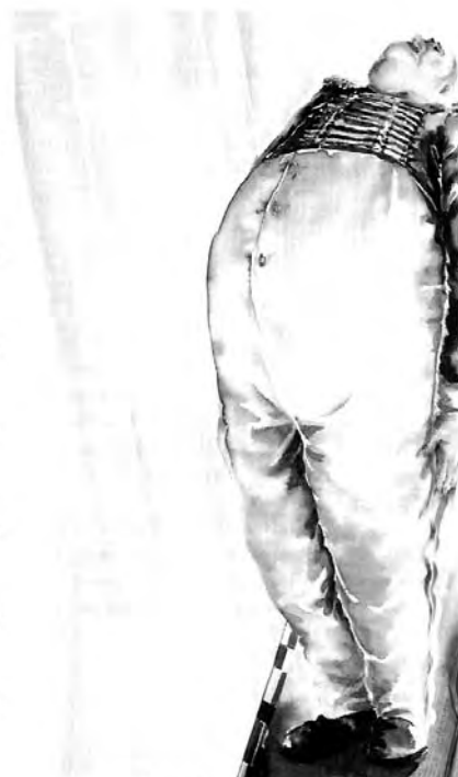
La ilustración de la portada y la de esta página son de Néstor López para Anoches. Noticias, obra escrita por Alejandro Casado, cine, televisión, entretenimiento, teatro y actividades han sido realizadas por Juan Ramón Torregrosa. La reproducción ha sido cedida por Vicens Vives a título gratuito.

Teatro de infancia por José González Torices