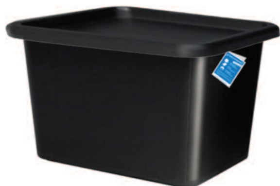
Contenedor del módulo de emergencia