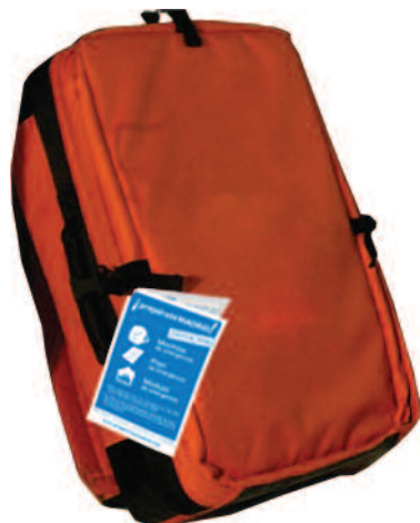
Mochila de emergencia