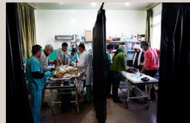
Una ambulancia con asistencia en la zona de operación de un hospital de MSF en la provincia de Aleppo del norte de Siria.