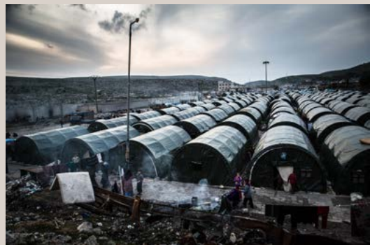
En el campo de Tab al Fitan, los desplazados sirios viven en condiciones de gran precariedad.