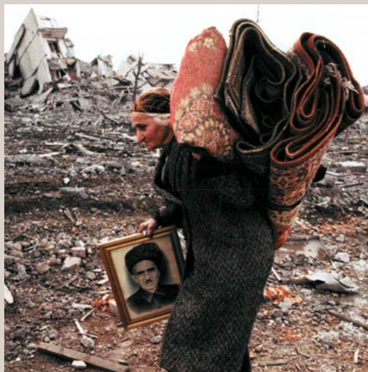
La ciudad de esta mujer en Grozni ya no existe. Los soldados rusos le han robado cinco minutos para morir.