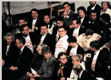
Los representantes de las organizaciones de MSF en la ceremonia del Nobel. Desde, en rojo, “Detened los bombardeos contra civiles en Grozni”.