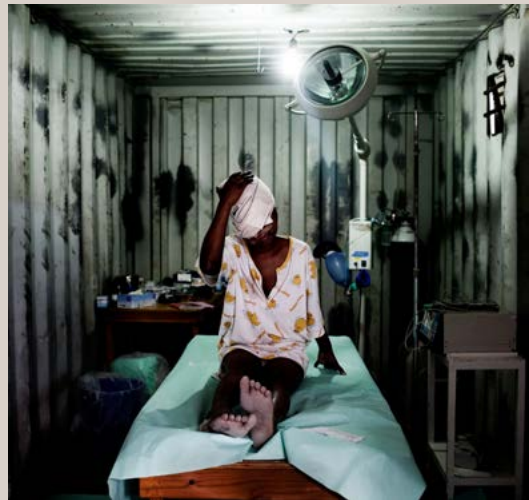
La situación crítica de heridos en Puerto Príncipe obliga a MSF a instalar un quiosque en un contenedor de mercancías.