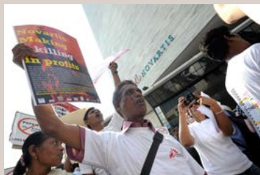
Gracias a su producción de medicamentos genéricos, India es la conocida como República Democrática del Grupo.