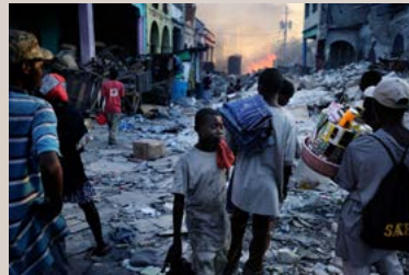
El centro de Puerto Príncipe, destruido por el terremoto, parece una zona de guerra.