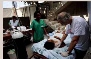
El hospital de Cambuz (Puerto Príncipe) resultó tan dañado que los pacientes tenían que ser operados en el exterior.