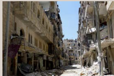
La población de Aleppo vive sumida en el terror de las bombas aéreas.