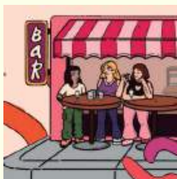
Imagen de la programación de la muestra de cine lésbico