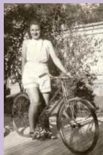
La poeta Gloria Fuertes