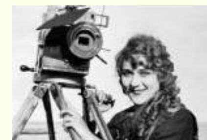
Alice Guy pionera en el mundo del cine