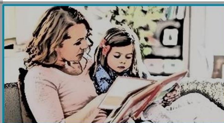
CAF N° 4

Retomamos los encuentros de este programa que invita a las familias a disfrutar con cuentos, música y actividades que estimulan la creatividad