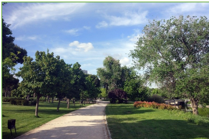
Las zonas verdes contribuyen a hacer de Madrid una ciudad más amigable

La experta considera que estas estrategias tendrán un impacto positivo en la imagen y autoimagen de las personas mayores. El hecho de ofrecerles alternativas de vivienda ayuda a reivindicar la gran diversidad de la población mayor. La supresión de barreras y la adaptabilidad de los domicilios para quienes tienen dificultades asociadas a los procesos de envejecimiento es otra clave para favorecer su autonomía.