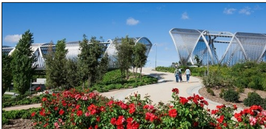
Los parques cada día se adaptan más a las necesidades de la población mayor e infantil

Nuestro entrevistado también pone el peso de la amigabilidad en un nuevo tipo de interrelación entre el espacio de la ciudad y la población. “En los parques nuevos se tiene en cuenta la accesibilidad en los accesos, en los columpios, para población infantil y mayores. Hay que trabajar lo intergeneracional para que no haya zonas tan delimitadas y segregadas” - dice.