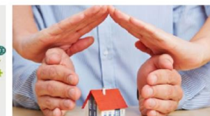
Servicios municipales dentro del domicilio