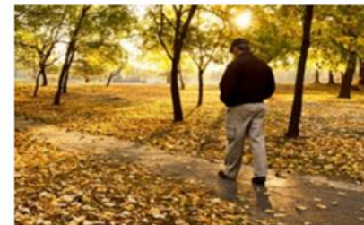
Soledad en las personas mayores

Nace con el objetivo de contribuir a disminuir el sentimiento de soledad de las personas mayores a través del abordaje integral de la soledad y de sus consecuencias desde el ámbito de la prevención, la detección y la intervención de la misma, con el deseo de mejorar la realidad en la que vivimos en la ciudad de Madrid, en especial la de quienes se sienten solas/os o aisladas/os