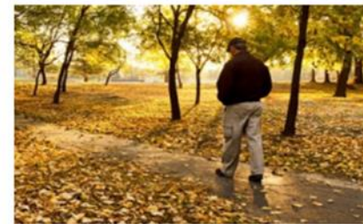
Soledad en las personas mayores

Nace con el objetivo de contribuir a disminuir el sentimiento de soledad de las personas mayores a través del abordaje integral de la soledad y de sus consecuencias desde el ámbito de la prevención, la detección y la intervención de la misma, con el deseo de mejorar la realidad en la que vivimos en la ciudad de Madrid, en especial la de quienes se sienten solas/os o aisladas/os