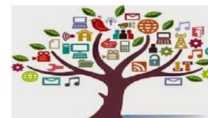
Servicios municipales fuera del domicilio