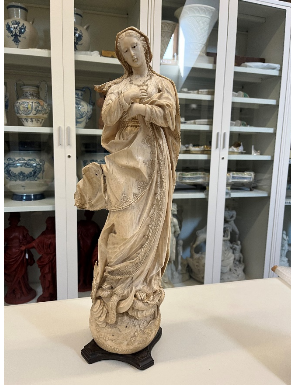
Ilustración 1 . Andrea Imbrol, Inmaculada Concepción, 1740 [ca], marfil.

Toda la escultura que se ha catalogado se distribuía entre las salas del museo, los tres los almacenes internos (almacén visitable, almacén de porcelanas y almacén de mansardas), otros dos externos (Almacén de Conde-Duque, el Almacén de Villa) y algunos depósitos en otras instituciones. La tarea se distribuyó precisamente por accesibilidad, en el caso del mes de agosto se catalogaron las obras del museo, posteriormente en septiembre y octubre las que se encontraban en Conde-Duque y, finalmente en noviembre aquellas que estaban en depósitos u otros almacenes.