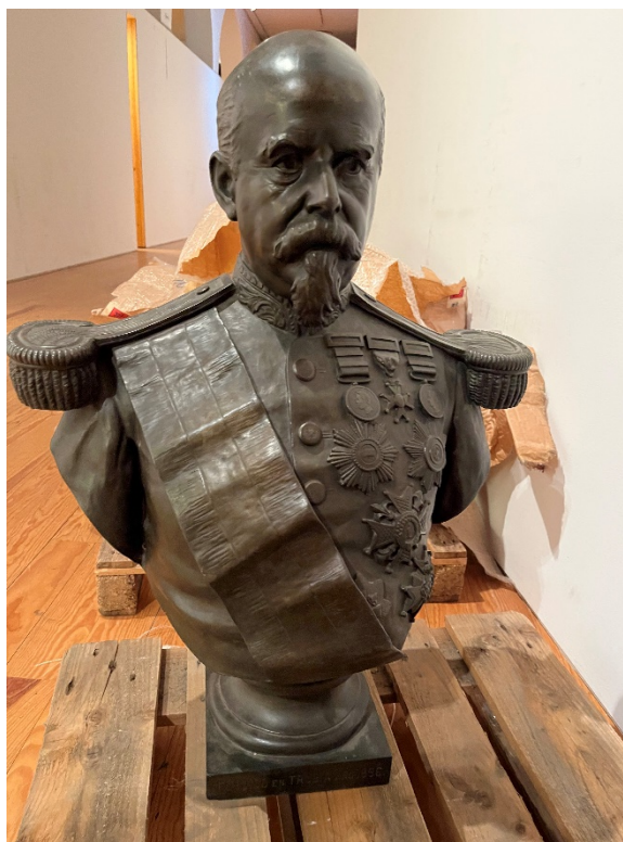
Ilustración 2 Cipriano Folguera Doiztúa, General Martínez Campos, 1896, 87 x 65 x 29 cm., bronce.

A continuación, se ha procedido a buscar información y bibliografía asociada a las piezas para poder completar de manera fidedigna cada uno de los campos tales como autoría, datación, bibliografía asociada etc. La investigación en este sentido se ha podido realizar gracias a los archivos (donde se preservan los informes de restauraciones anteriores, por ejemplo), la biblioteca del propio museo o en la documentación online existente. En este sentido, otra herramienta que ha sido fundamental en la investigación es el cotejo de muchas de