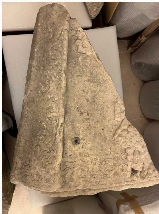
Ilustración 3 Fragmento manto de la Virgen de la Almudena

apareció la imagen de María Santísima de la Almudena dentro del cubo que había en este sitio; y para memoria de tan dichosa aparición, el Excelentísimo Ayuntamiento ha ejecutado esta obra, año de 1830. La imagen es conocida gracias a la fotografía de Jean Laurent, La Cuesta de la Vega , datada entre 1860-1886, pero además, esta imagen nos ayuda a contrastar que los fragmentos que se conservan en el Museo de Historia corresponden a esta representación de la Virgen. El museo cuenta con dos fragmentos del manto, la cabeza de la virgen y, durante el tiempo de realización de la beca hemos podido localizar también la cabeza del niño que asoma por su lado izquierdo. Se ha contrastado la materialidad de cada uno de los fragmentos para concluir que forman un todo.