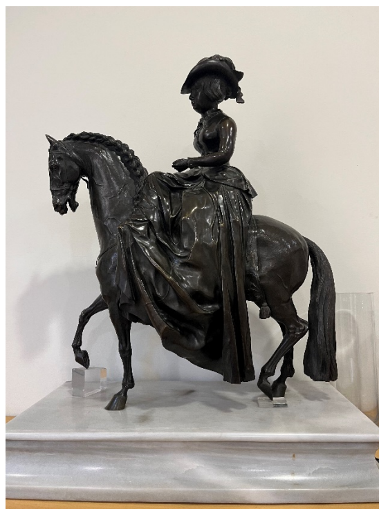
Ilustración 4. Anónimo, Retrato ecuestre de Isabel II niña, bronce y mármol, 1847 [ca.]

Otra de las conclusiones a nivel general es la variedad material. Hemos catalogado alabastros como los de Bartolomé Sureda (los únicos que se conocen fechados de este artista), barros, escayolas, bronce, mármol, escultura lítica, marfil, platería y madera.