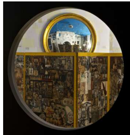
El espejo convexo deforma la imagen.