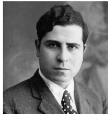
Ramón Gómez de la Serna.

Los asistentes a la tertulia eran los pombianos y se reunían los sábados por la noche para hablar de literatura, escribir, jugar, e incluso disfrazarse.