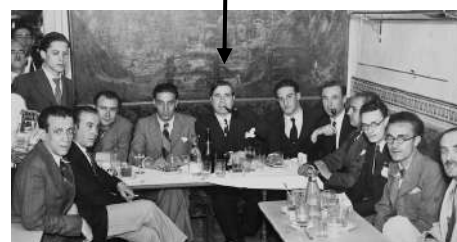
Ramón Gómez de la Serna y los pombianos en la tertulia del Café Pombo.