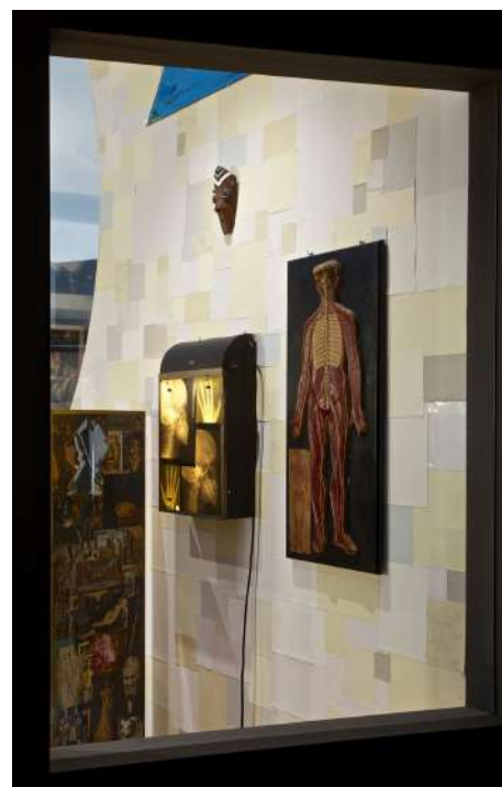
Representación del interior del cuerpo humano.

Lo mejor que puedes hacer es pasear y mirar a través de las ventanas del despacho. ¡Seguro que te llevas muchas sorpresas!