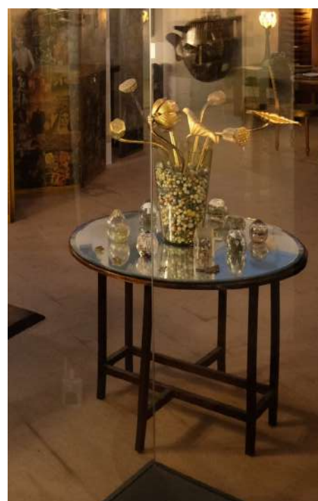
Mesa con canicas.