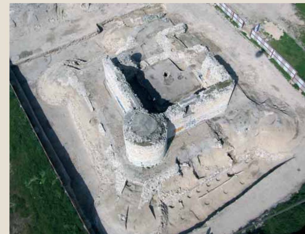
1989-2010: excavación y estudio