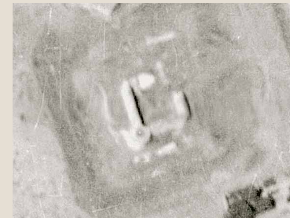
1950: restos arqueológicos

Hoy conocemos mejor la historia de La Alameda gracias a las excavaciones arqueológicas del castillo y su entorno y a las investigaciones realizadas en varios archivos a lo largo de los últimos años. Aunque el principal objeto de interés de estos estudios ha sido el castillo y la historia del señorío de Barajas y la Alameda, no han dejado de prestar atención a las etapas anteriores de una larga historia en la que el castillo no representa más que un eslabón, ni a sus huellas en el mismo espacio o sus alrededores.