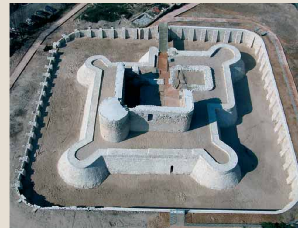
2010: reintegración arquitectónica