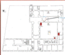
Plano del Museo Municipal.

La propuesta de recuperación de la estructura hidráulica, ya aprobada por la Dirección General de Patrimonio Histórico de la Comunidad de Madrid, aprovecha las circunstancias de que el discurso del Museo Municipal se inicia en los albores de la época moderna, y que la noria se sitúa muy cercana al comienzo del recorrido por la futura exposición permanente. En consecuencia, se proyecta reconstruir parcialmente la estructura en una sala que estará dedicada a narrar la importancia del agua en el desarrollo de la ciudad de Madrid y contará con recursos museográficos que faciliten la comprensión del funcionamiento de la estructura localizada, su método de construcción y su sistema de alimentación, muy característico de Madrid desde época islámica, basado en un viaje de agua excavado en el terreno natural.