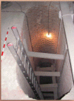
Vista general durante el proceso de excavación.

Los trabajos arqueológicos realizados con motivo de la rehabilitación del Museo Municipal de Madrid han permitido documentar el vaso de una noria de sangre del siglo XVII que se pretende conservar in situ e incorporar, como un recurso museográfico de excepción, a la exposición permanente. La excavación, realizada al amparo de la Ley 10/1998 de Patrimonio Histórico de la Comunidad de Madrid, afecta al antiguo Hospicio terminado por Pedro de Ribera en los primeros años del siglo XVIII, que se halla incluido en la Zona Arqueológica Recinto Histórico de la Villa de Madrid (declarada Bien de Interés Cultural en 1993).