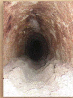
Vista de agua canalizada de alimentar la noria.

La propuesta de recuperación de la estructura hidráulica, ya aprobada por la Dirección General de Patrimonio Histórico de la Comunidad de Madrid, aprovecha las circunstancias de que el discurso del Museo Municipal se inicia en los albores de la época moderna, y que la noria se sitúa muy cercana al comienzo del recorrido por la futura exposición permanente. En consecuencia, se proyecta reconstruir parcialmente la estructura en una sala que estará dedicada a narrar la importancia del agua en el desarrollo de la ciudad de Madrid y contará con recursos museográficos que faciliten la comprensión del funcionamiento de la estructura localizada, su método de construcción y su sistema de alimentación, muy característico de Madrid desde época islámica, basado en un viaje de agua excavado en el terreno natural.