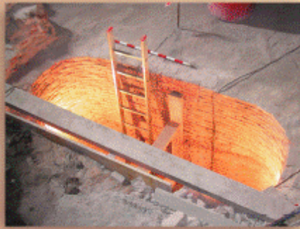
Vista general durante el proceso de excavación.