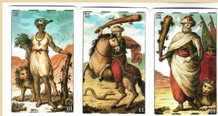
Figura 5. Las figuras del palo de los bastos de la baraja de Manuel Alegre: la sota, el caballo y el rey. En ellas se aprecia la influencia de su procedencia mameluca.

Centrando nuestra mirada en la baraja española, en su historia y en la de su producción, debemos señalar que para fabricar los naipes se requería en España de una autorización expresa de la Corona, medida con la que se trataba de evitar posibles trampas y engaños, ya que las cartas eran siempre motivo de continuas reyertas. Otra peculiaridad de la baraja española, es que se utilizaron las llamadas "pintas" o líneas discontinuas que se imprimían en la parte superior e inferior de las cartas, para indicar al palo al que pertenecían.