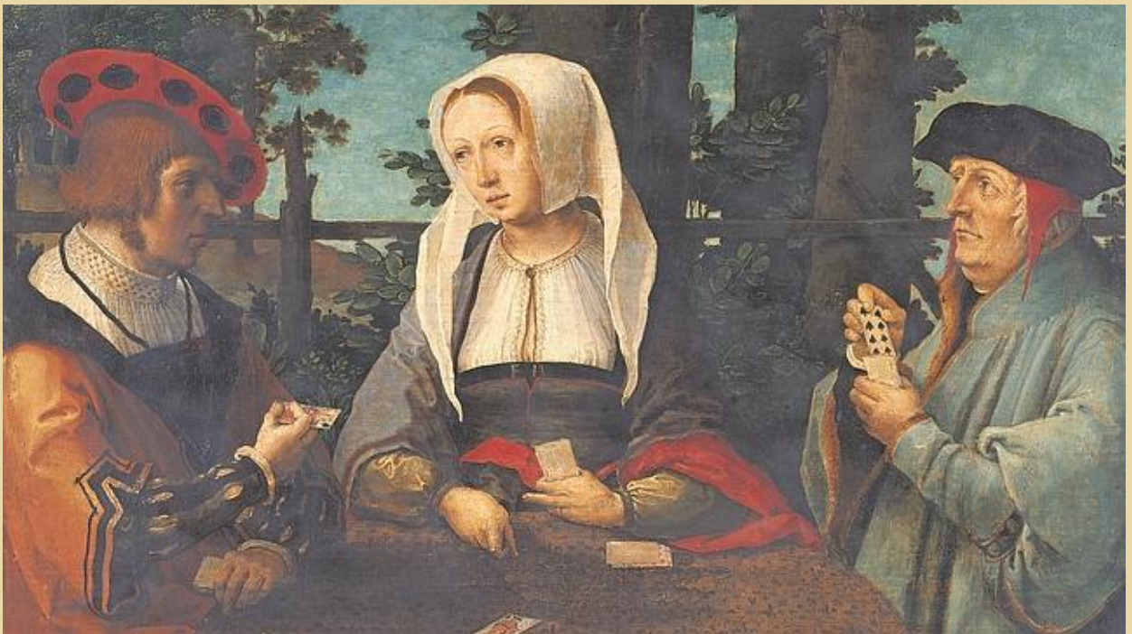
Figura 2. Jugadores de cartas. Lucas Van Leyden. 1520

Los ejemplares y testimonios europeos más antiguos sobre los naipes se sitúan en Italia, según fuentes de estudiosos de este proceso de introducción, como el Centro de Documentación del Museo del Juguete en Cataluña, que sostiene esta afirmación. Del Reino de Nápoles, que entonces era posesión de la Corona de Aragón, habrían pasado a Cataluña y, desde esa zona, pasó al resto de la península ibérica. Esto está respaldado, etimológicamente, por el hecho de que la palabra naip proviene del catalán "naip" y que, a su vez, procede del árabe "ma'íb". Mientras que, documentalmente, también tenemos que la referencia más antigua sobre el juego de los naipes en España y, posiblemente, una de las primeras menciones europeas a las cartas, se encuentra en un documento de 1378, conservado en los archivos municipales de Barcelona.