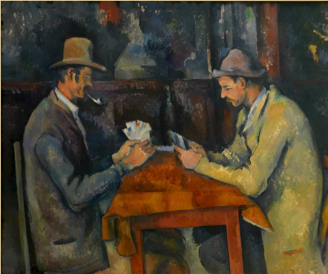
Figura 3. Los jugadores de cartas. Paul Cézanne. 1894-1895