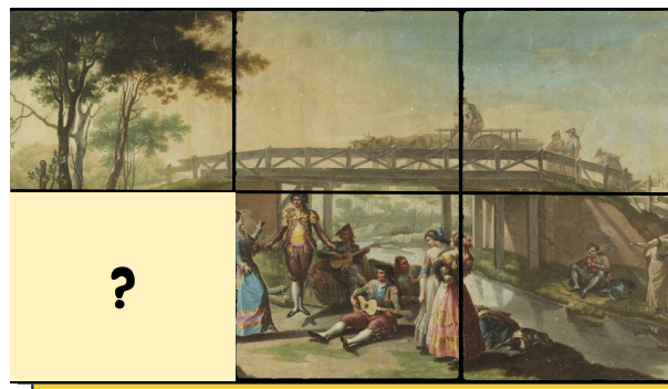
Baile junto al puente en el canal del Manzanares Ramón Bayeu y Subías

Busca éste cuadro de la sala 3 ¿Qué pieza falta en este puzzle?